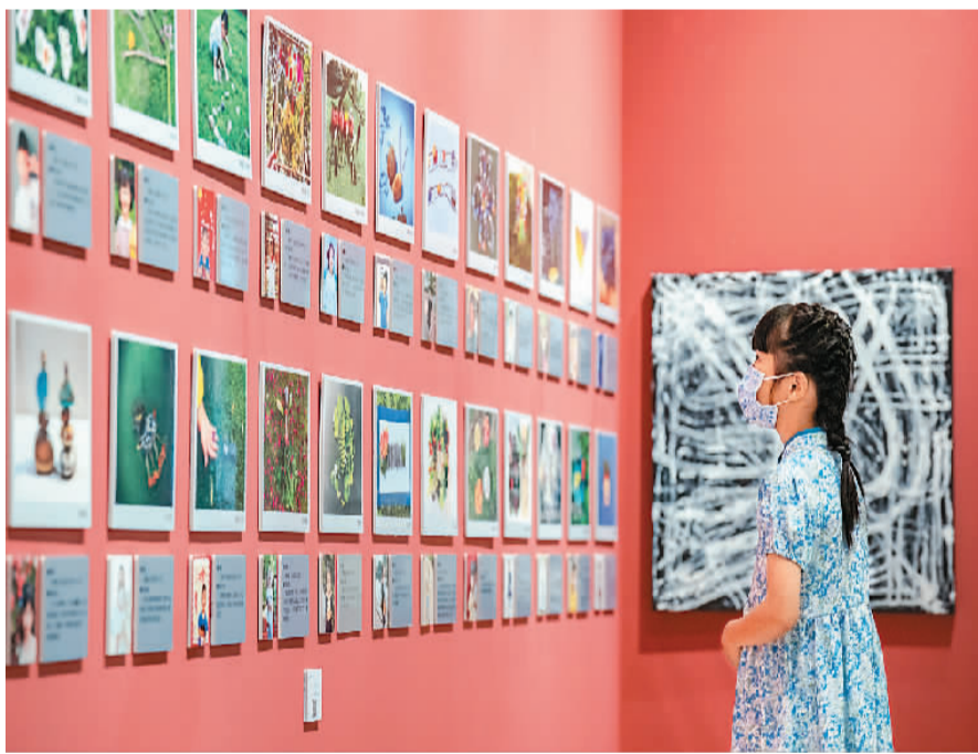
近日，一批由小朋友原创的艺术作品在重庆市大渡口区美术馆展出，吸引众多家长和孩子前来参观。

“中国戏曲在海外”研讨会是北京外国语大学国际中国文化研究院继举办2017年“中国戏曲在亚洲的传播”、2018年“中国戏曲在欧洲的传播”、2019年“中国戏曲在北美的传播”研讨会之后的又一次重要会议，旨在以全球视野探讨中国戏曲在海外的传播与影响，探索传统戏曲研究新方法新视角。