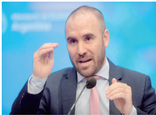
新華社北京7月3日電 阿根廷經濟部長馬丁·古斯曼2日宣布辭職。古斯曼是促成國際

貨幣基金組織批准對阿根廷債務再融資計劃的關鍵人物，他的辭職給本就困難重重的阿根廷經濟再添不確定性。