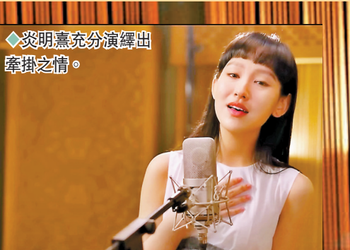
◆ 炎明熹充分演繹出牽掛之情。