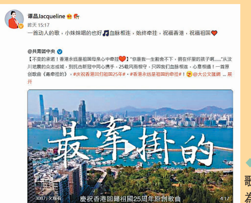
◆ 譚晶轉發歌曲MV並大為讚賞。