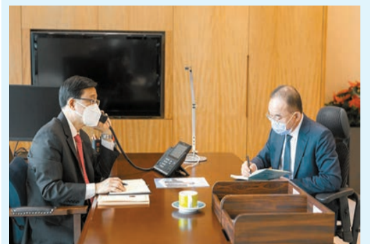
李家超（左）昨日致電廣東省及深圳市領導闡述新一屆特區政府的工作方針。

【香港商報訊】記者戴合聲報導：行政長官李家超昨日分別致電廣東省書委書記李希、廣東省省長王偉中、深圳市委書記孟凡利及深圳市市長覃偉中，向他們闡述新一屆特區政府的工作方針。