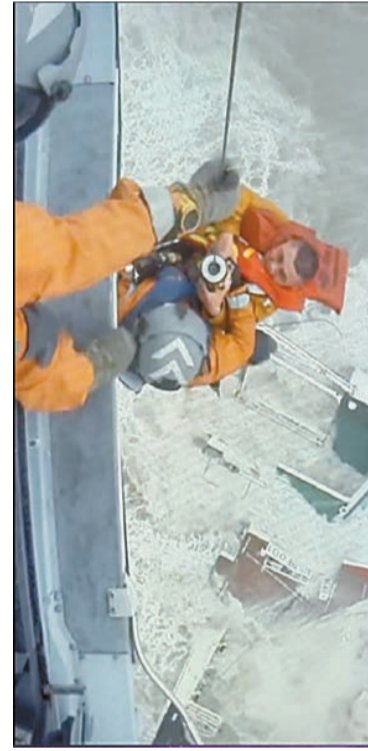
香港飛行服務隊接報後到場搜救，用鋼索吊起遇險船員。

颱風「暹芭」吹襲本港期間，天文台發出8號風球長達21小時，帶來連場狂風暴雨，截至昨日下午4時，政府1823電話中心收到45宗塌樹報告，及渠務署確認一宗水浸個案。醫院管理局表示，截至昨日下午4時30分，3名市民（2男1女）在風暴期間受傷，於公立醫院急症室接受診治。