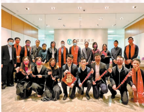
農行香港分行管理層與部分員工合影。