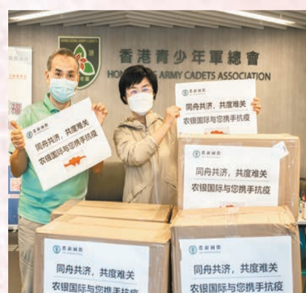
農銀國際捐獻快速檢測試劑。

2011-2021年，農行香港分行連續十年獲得香港社會服務聯會頒發的「商界展關懷」稱號，該行長期持之以恆地開展公益慈善活動受到社會的廣泛認可和肯定。多年來，農行香港分行積極參與本地基層民衆的幫扶和青少年發展工作，與香港明愛社會服務中心、九龍樂善堂、新家園協會等香港知名公益組織保持良好合作，開展了「溫暖進社區」「文化進校園」「物資送基層」等眾多活動。