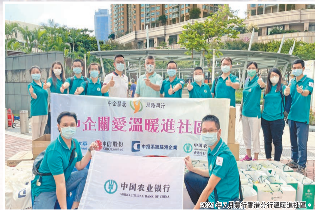
2021年7月農行香港分行溫暖進社區。

和可持續金融資助計劃」認可安排」資質，可見監管機構對該行積極促進本地綠色金融發展的認可。