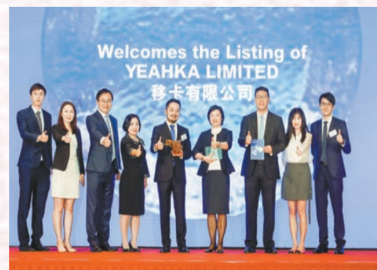
農銀國際保薦移卡有限公司在香港聯交所主板成功上市。

農行香港分行依託農行集團先進的一體化跨境清算服務平台，充分發揮CIPS直接參與行的業務優勢，為各類跨境交易提供安全、高效、便捷的資金清結算服務，以更高效率的支付清算體驗助力人民幣國際化的發展戰略。並積極參與財政部和人民銀行的境外債券發行和投資，人民幣資產佔比逐年提升。