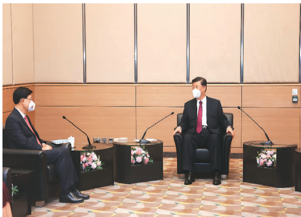
七月一日上午,国家主席习近平在香港会见刚刚就职的香港特别行政区行政长官李家超。