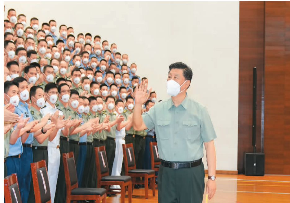
七月一日,中共中央总书记、国家主席、中央军委主席习近平视察了中国人民解放军驻香港部队,代表党中央和中央军委,向驻香港部队全体官兵致以诚挚的问候。这是习近平亲切接见驻香港部队官兵代表。