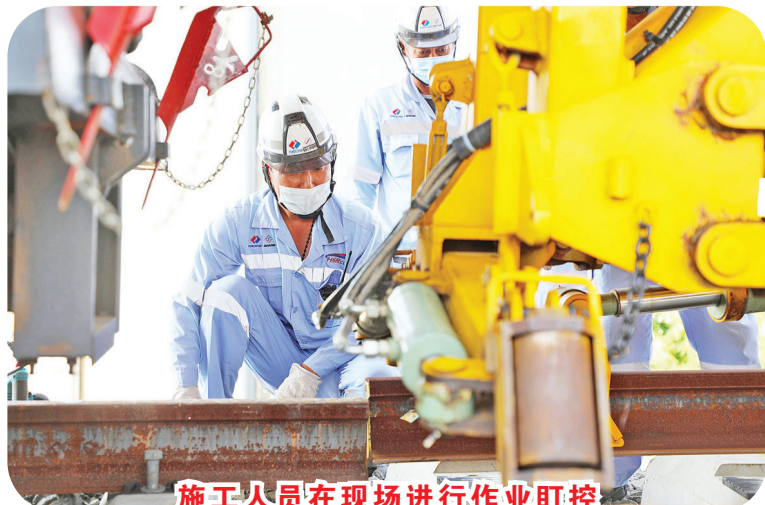
施工人员在现场进行作业盯控

志性项目，也是中国高铁首次全系统、全要素、全产业链在海外落地的典范工程。项目建成后，雅加达到万隆的旅行时间将由现在的3个多小时缩短至40分钟。