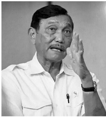
海事与投资统筹部长卢虎(Luhut Binsar Pandjaitan)声称,为了能大幅提高农民手中的连梗油棕果实价格,他已敦促贸易部要加快出口棕榈油。

【本报讯】海事与投资统筹部长卢虎(Luhut Binsar Pandjaitan)上周末在雅加达通过书面方式表示,为了能大幅提高农民的连梗油棕果实价格,希望由朱尔吉菲里部长领导下的贸易部,能加快出口棕榈油和食用油原材料,甚至要求自7月1日起,将出口乘数比例提高到国内市场义务(DMO)的七倍。