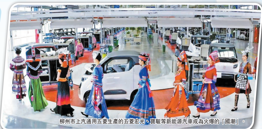
柳州市上汽通用五菱生產的五菱宏光、寶駿等新能源汽車成為火爆的「國潮」。

廣西柳州，一座「工業城市中山水最美，山水城市中工業最強」的老牌工業城，一座因「臭臭的」螺螄粉爆紅的正向「網紅」城市，柳工、五菱、柳鋼……一個個工業企業在柳州興盛。柳州以「工業思維」推動經濟高質量發展的背後，折射出其一流的營商環境。柳州市委、市政府表示，柳州所堅持的營商環境，是用心用力支持企業發展，幫助企業破解瓶頸難題，與企業同舟共濟、攜手並進。 唐琳 徐玉瑩 蔡穎思