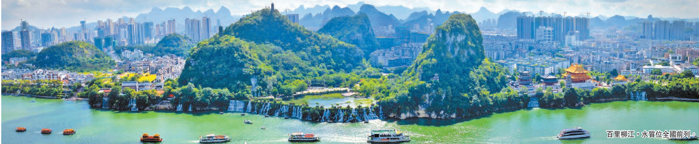
百里柳江，水質位全國前列。