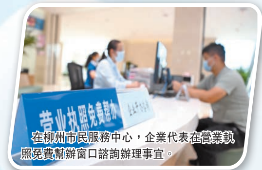
在柳州市民服務中心，企業代表在營業執照免費幫辦窗口諮詢辦理事宜。

截至目前，柳州市優化營商環境202項指標任務已全面完成，正逐步形成與高質量發展要求相適應的營商環境競爭優勢。柳州市積極推動螺螄粉產業高質量發展獲得國務院第八次大督查通報表揚，成為改革創新典型。「多測合一」助力工程建設項目審批提速提質經驗做法列入自治區2021年第一批優化營商環境改革典型複製推廣。打造全區企業住所和經營場所標準化地址庫唯一試點，首推企業登記檔案遠程查詢服務。