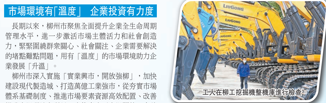
工人在柳工挖掘機整機庫進行檢查。

公平正義的法治化良好營商環境是提振企業發展信心的關鍵。柳州市通過出台知識產權保護和促進辦法、知識產權獎勵補助辦法，推動柳州市知識產權信用體系建設。構建「一網聯動、隨機抽查、綜合執法、聯合監管」的新型監管模式，雙隨機抽查事項覆蓋率100%，監管執法信息公示率100%。立足審判執行工作職能，發揮司法能动性，解決商業糾紛用時151天，同比降低7.93%。全國首創「破立有方」破產案件審理監督平台，實現對案件全流程監督管理，開通不動產遠程查控系統權限，極大提升破產案件資產處置效率。