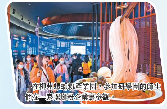
在柳州螺螄粉產業園，參加研學團的師生們在一家螺螄粉企業裏參觀。