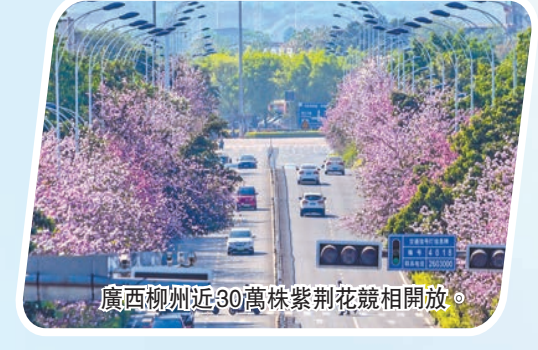
廣西柳州近30萬株紫荊花競相開放。