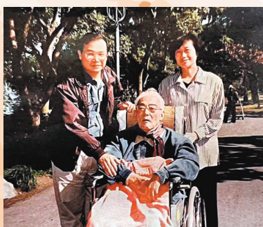
◆ 1995年秋，潘耀明在杭州探訪巴金。