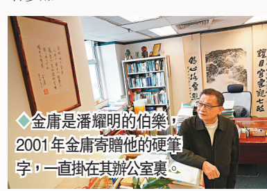
◆ 金庸是潘耀明的伯樂，2001年金庸寄贈他的硬筆字，一直掛在其辦公室裏。