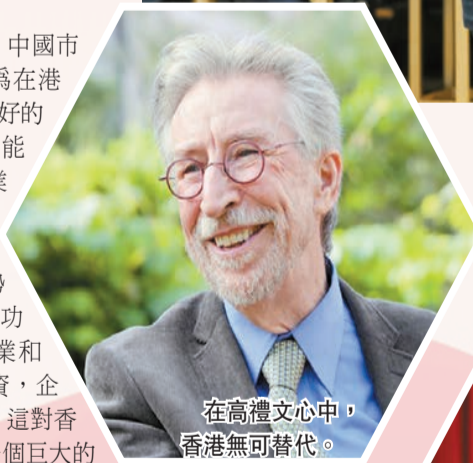
在高禮文心中，香港無可替代。