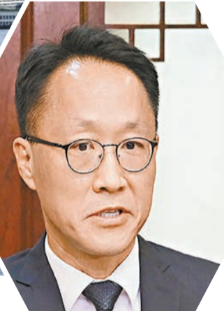
▲白龍天認為，香港在國家經濟發展中有着獨特的地位和作用。