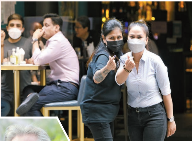
▲香港這亞洲魅力之都，外國人都讚不絕口。