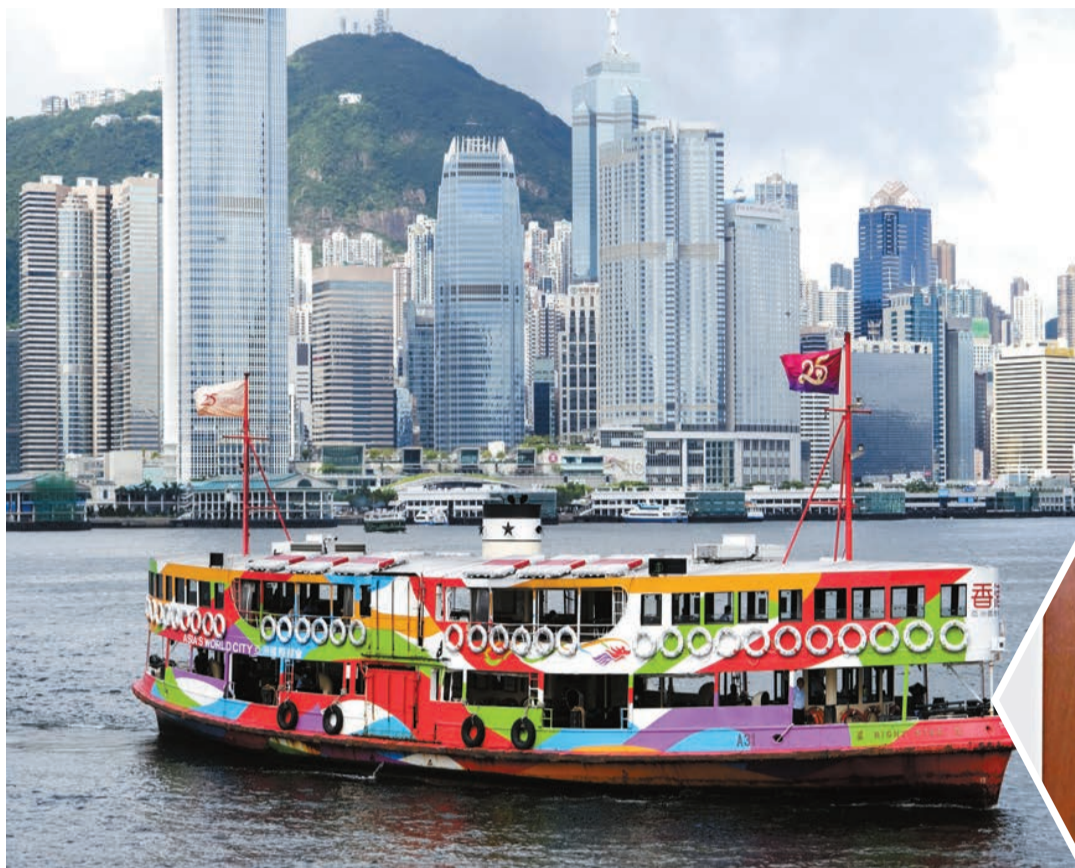
全球首100大銀行中，有超過70家在香港營業，超過29家跨國銀行在香港設置地區總部。

香港是全球最大和最重要的離岸人民幣業務中心，進一步強化全球離岸人民幣業務將能增強香港作為連接國家與世界的重要橋樑作用。白龍天認為，香港在中國經濟發展中有着獨特的地位和