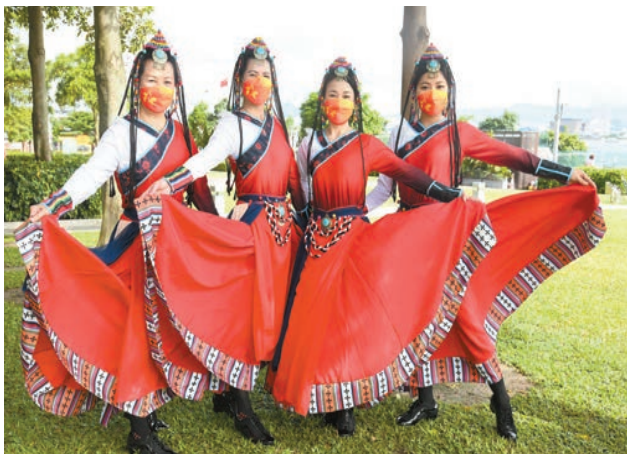
展旗活動現場有舞蹈表演，氣氛一片歡欣。

開幕，100位抗疫義工在開篷巴士上展示兩幅巨型國旗和特區區旗，以進一步弘揚無私奉獻、服務社區的抗疫精神。隨後，巴士巡遊各區，國旗區旗在各處飄揚，令市民感受到喜慶氣氛。