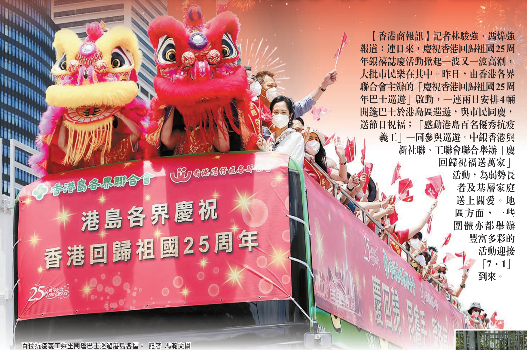
百位抗疫義工乘坐開篷巴士巡遊港島各區。

【香港商報訊】記者林駿強、馮煒強報道：連日來，慶祝香港回歸祖國25周年銀禧誌慶活動掀起一波又一波高潮，大批市民樂在其中。昨日，由香港各界聯合會主辦的「慶祝香港回歸祖國25周年巴士巡遊」啟動，一連兩日安排4輛開篷巴士於港島區巡遊，與市民同慶，送節日祝福；「感動港島百名優秀抗疫義工」一同參與巡遊。中銀香港與新社聯、工聯會聯合舉辦「慶回歸祝福送萬家」活動，為弱勢長者及基層家庭送上關愛。地區方面，一些團體亦都舉辦豐富多彩的活動迎接「7·1」到來。