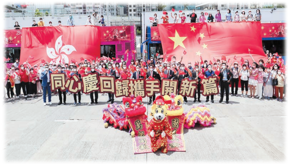
「慶祝香港回歸祖國25周年巴士巡遊」昨日啟動。