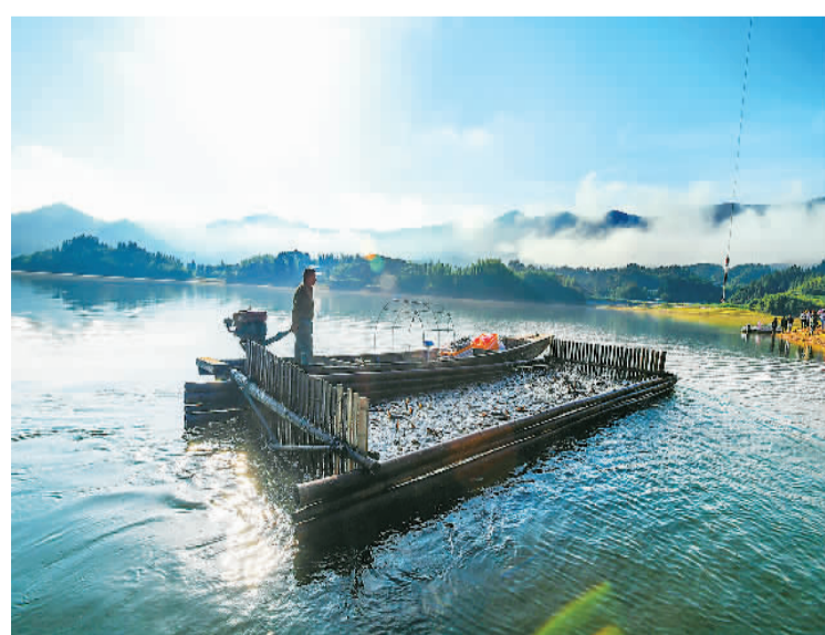
近年来，江西省宜春市靖安县发挥水资源优势，通过以库养鱼、以鱼增收、以鱼净水的良性循环发展模式，把生态渔业培育成当地特色产业，推进水产业绿色可持续发展。图为靖安县官庄镇罗湾水库，渔民将捕捞的生态鳊鱼运往岸边，准备销往市场。

入保持较快增长，实现业务收入36184亿元，同比增长10.6%。利润总额增速扭负为正。1-5月份，软件业利润总额3747亿元，同比增长1.9%。