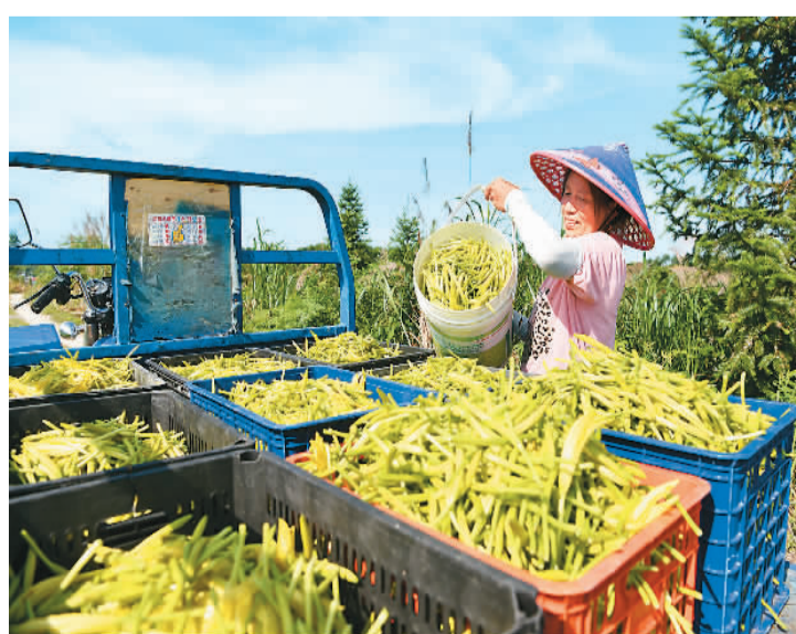
湖北省咸宁市通城县近年来根据市场需求不断调整品种结构，以中药材基地套种黄花草，以短养长、循环发展，提高土地使用率，依靠科技种养增加了集体收入。图为通城县大坪乡辉煌村黄花草基地，村民在采摘黄花草。