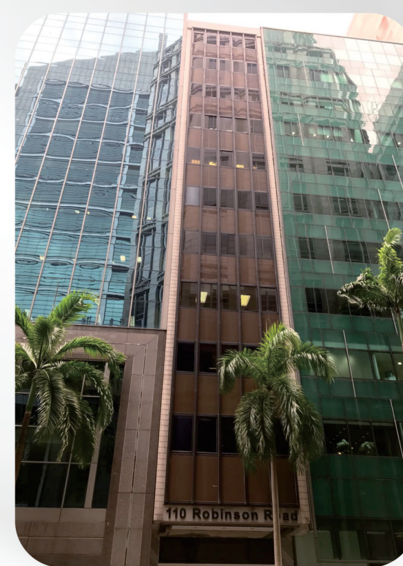
ERH BUILDING SINGAPORE