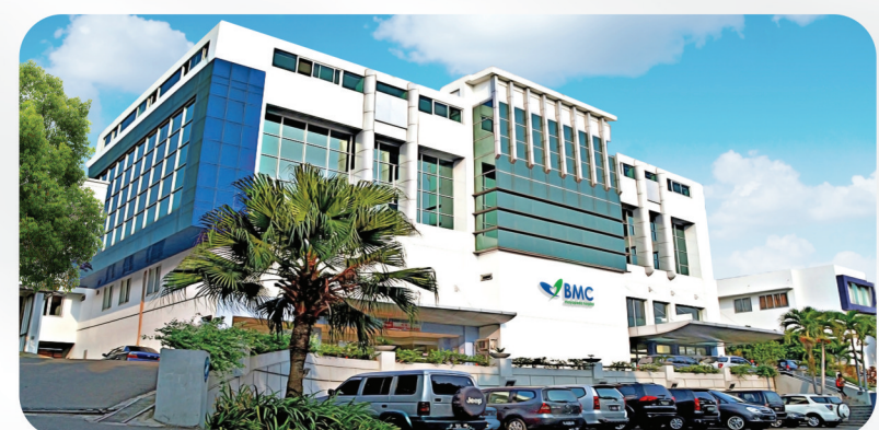
BMC Mayapada Hospital Bogor