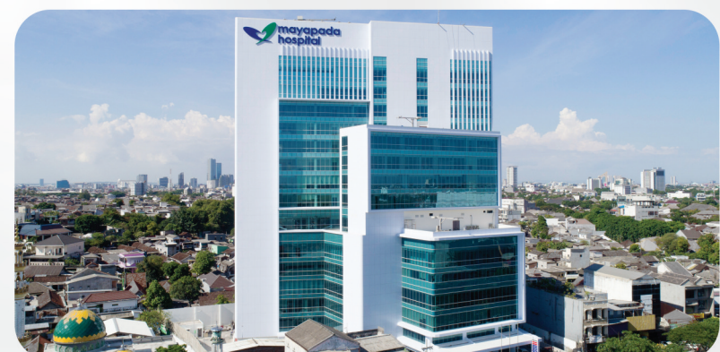
Mayapada Hospital Surabaya