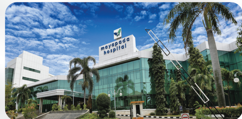
Mayapada Hospital Tangerang