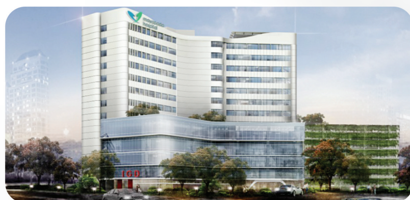
Mayapada Hospital Bandung

新加坡國信集團有限公司 ( 上市公司 ) 董事主席 Chairman MYP Public Listed Singapore Ltd ( Juli 2012 - Sekarang )