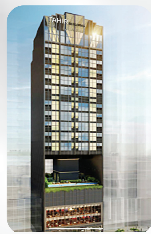
TAHIR BUILDING SINGAPORE