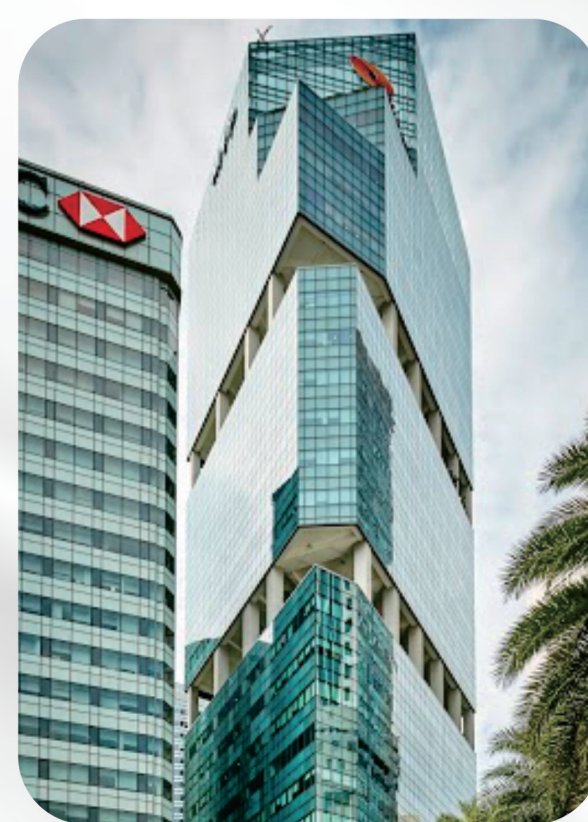
MYP CENTER SINGAPORE