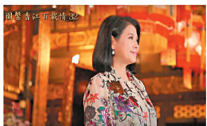
◆筆者在電視特輯《圍繫香江百載情》，分享《老子》：「多言數窮，不如守中。」

利用，造成人與人之間的矛盾，更甚者引起社會混亂、世界紛爭。10多年前，我們在北京跟中國國際戰略學會經年主辦的「中國與世界」國際學術研討會，就以「網絡安全」、「訊息安全」等作爲議題，邀請各國一起參與探討。 在法規還未跟得上網絡進展一日千里、卻又倡議言論自由的同時，我們更要學懂自律「慎言」，從而去珍惜、保障、發揮我們的自由——「多言數窮，不如守中」深藏智慧，什麼時候該說，什麼時候不該說，說話把握的分寸非常重要，要「言必有中」，切忌無的放矢。 其實，中國的箴言，外國人也有相同的認知。「雄辯是銀，沉默是金。」——英國文豪托馬斯·卡萊爾的著名諺語。意思是雄辯像銀子般貴重，但關鍵時刻，沉默像金子一樣，更爲重要。可見東西文化在這方面，也有着同樣的價值觀。