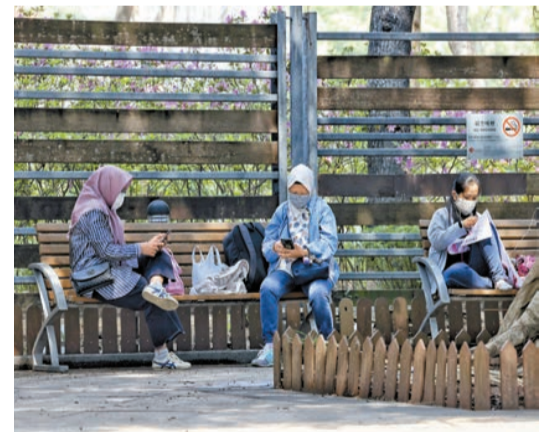
港府再延長約滿外傭在本港逗留期限。