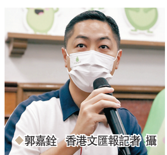
◆郭嘉銓 香港文匯報記者 攝

香港文匯報訊（記者 曾立本）香港警務處助理處長（特別職務）郭嘉銓26日接受訪問時憶述，5年前習近平總書記來港視察時，他擔任機場警區指揮官，當習近平總書記步出機艙的一刻，他在遠距離一睹習近平總書記的風采，當時「習近平總書記對警隊要員保護組的人員很親切，更與大家一齊大合照」，令他感受到習近平總書記十分關心香港的發展，關懷香港每一個階層的市民。