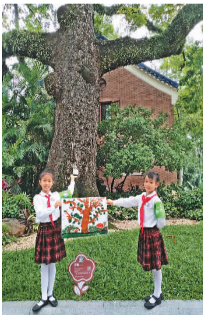
2022年5月22日，广州市越秀区旧部前小学林长小队的同学们在“木棉王”树下描绘了她们心中这棵古树苍劲挺拔的形象。

在“六一”国际儿童节和6月5日“世界环境日”期间，中山纪念堂举办了广州市青少年寻访中山纪念堂生物多样性大课堂活动和“诗情绿意”生态历史文化游径首发仪式。