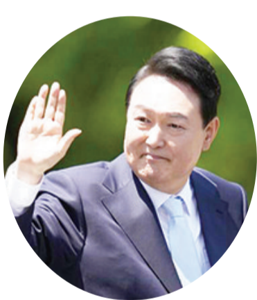
资料图：韩国总统尹锡悦。

中新网6月27日电 据韩联社报道，当地时间27日下午，韩国总统尹锡悦从首尔机场出发前往西