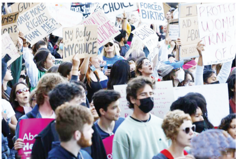
当地时间6月24日，美国联邦最高法院推翻确立堕胎权的判例“罗诉韦德案”后，美国民众举行抗议活动。

中新网6月27日电 据外媒报道，美国哥伦比亚广播公司(CBS)和民调机构YouGov当地时间26日公布的民调显示，超半数美国人认为，美国最高法院推翻“罗诉韦德案”的裁