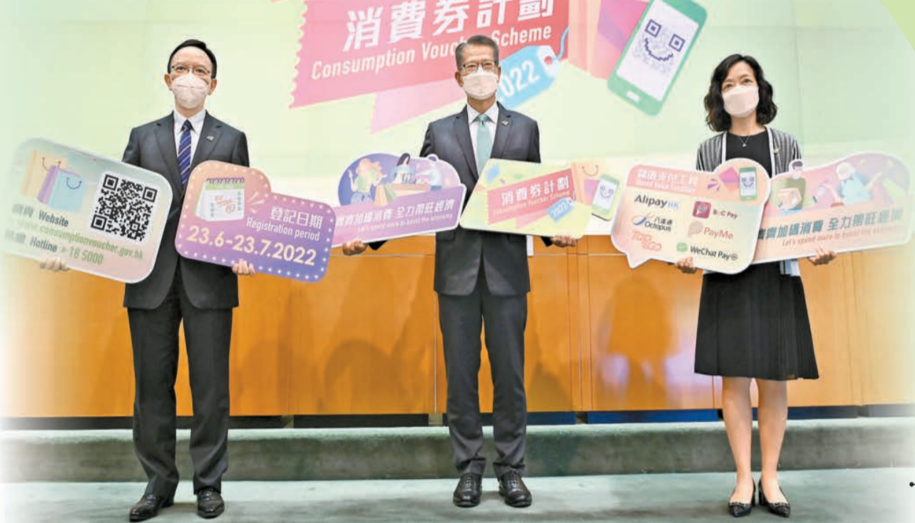
萬眾期待的第二期電子消費券將會在8月7日起分階段派發。