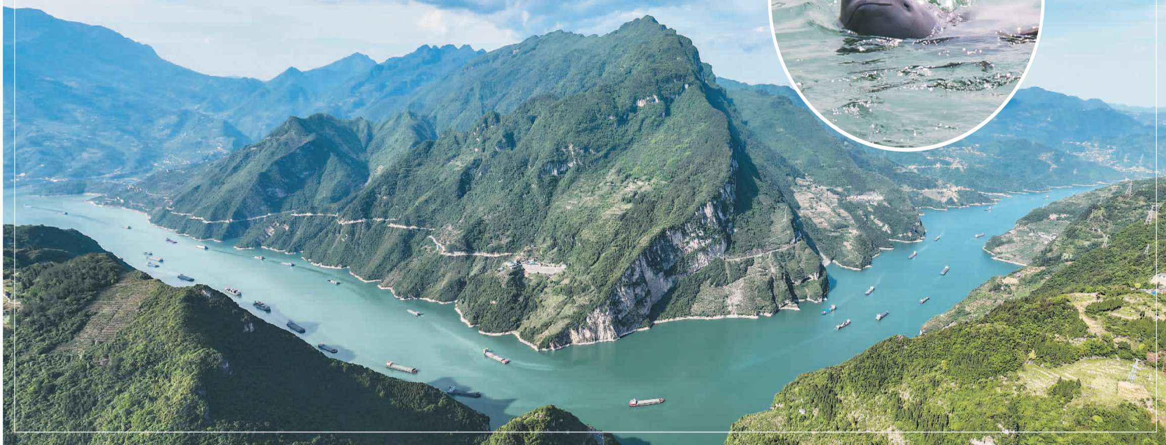
◀ 2021年5月11日，在湖北省宜昌市江边，长江江豚在水中嬉戏。

“微笑天使”江豚等珍稀生物回来了，烟囱林立的化工厂整治了，“灰头土脸”的砂码头消失了……仲夏时节，长江两岸成为人们休闲健身纳凉的好去处。漫步江边，戏水江畔，只见江水澄碧、草木葱茏。