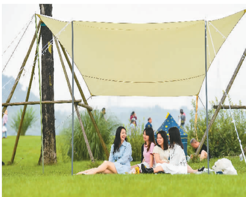
◀ 六月五日，游客在长江上游最大的江心岛重庆广阳岛休闲。