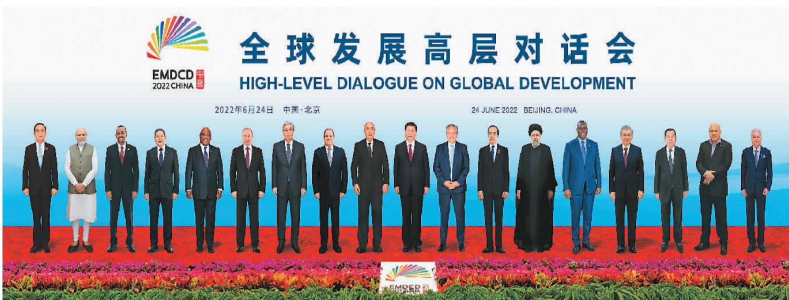
6月24日晚, 国家主席习近平在北京以视频方式主持全球发展高层对话会并发表题为《构建高质量伙伴关系 共创全球发展新时代》的重要讲话。