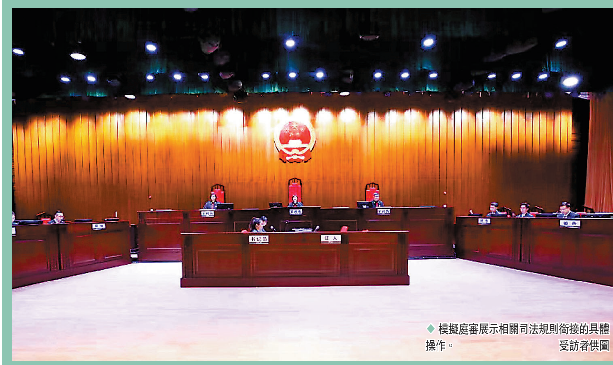
◆ 模擬庭審展示相關司法規則銜接的具體操作。

香港文匯報訊（記者方俊明廣州報道）「粵港澳大灣區司法規則銜接模擬庭審」22日在廣州市中級人民法院舉行，圍繞一宗涉港買賣合同糾紛，通過庭前程序和庭審程序，分別展示多項相關司法規則銜接的具體操作。香港文匯報記者23日從該法院獲悉，借鑒港澳司法規則，6項司法規則銜接操作指引正式發布，為深化灣區司法規則銜接作出積極探索、提供有益借鑒。其中，借鑒香港的文件透露規則，探索內地審前程序「證據開示」。有香港律師表示，通過灣區司法規則的銜接促進互學互鑒，對完善跨境商事案件審判機制、多元糾紛解決機制也起到推動作用，而且進一步提升港人對內地司法制度的認同感。