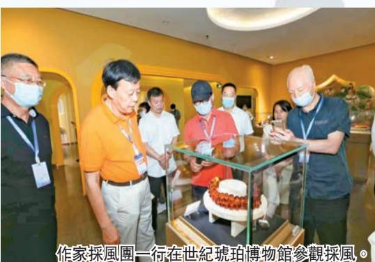
作家採風團一行在世紀琥珀博物館參觀採風。