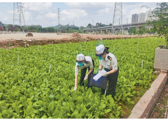
深圳海關關員對轄區供港蔬菜種植基地開展現場監管。

這期間，深圳海關不斷改革創新監管，2009年率先探索供港蔬菜電子化監管，首創供港蔬菜加工全過程視頻監管模式；2014年建立專項抽檢、風險監測及監