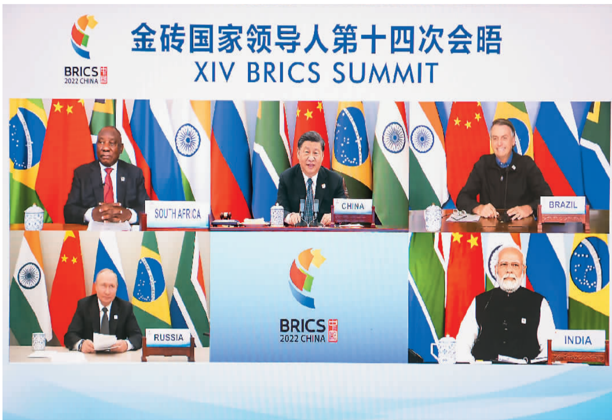
6月23日晚, 国家主席习近平在北京以视频方式主持金砖国家领导人第十四次会晤并发表题为《构建高质量伙伴关系 开启金砖合作新征程》的重要讲话。