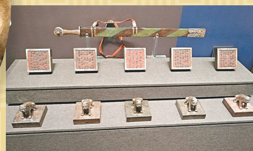
◆以東歸而聞名於世的土爾扈特蒙古首領的佩刀和印章