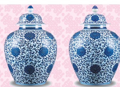
◆清乾隆青花纏枝蓮紋太白蓋罐(一對)

「吉」字紋等，都會以不同的書法形式作為紋飾出現在瓷器、銅器、玉器之上。筆者的收藏中，有一件「清乾隆銅胎掐絲琺瑯纏枝花卉八寶福壽童子托足八方蓋爐」，其上就可見諸多不同類型的吉祥紋飾，可以一睹這些經典的紋飾造型。