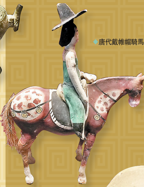
◆唐代戴帷帽騎馬侍女俑