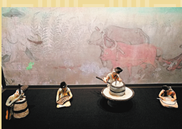
◆唐代彩繪勞動婦女俑