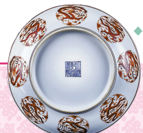
◆清乾隆珊瑚紅圓龍紋內八寶壽字紋碟