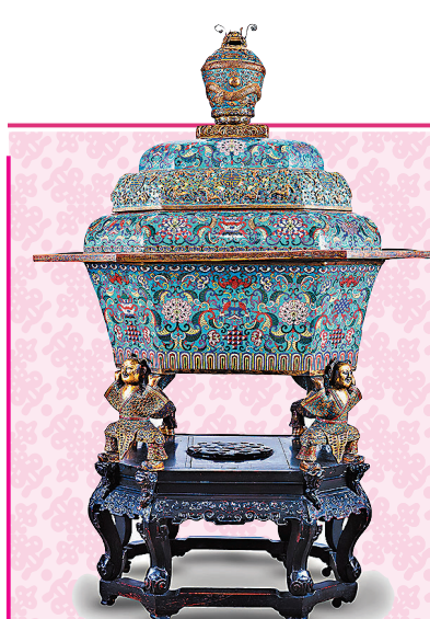
◆清乾隆銅胎掐絲琺瑯纏枝花卉八寶福壽童子托足八方蓋爐

如今，在天山電影製片廠老樓，新疆電影博物館正在緊鑼密鼓推進；中國鐵路烏魯木齊局集團有限公司也正在打造4,000餘平方米的新疆鐵路陳列館；新疆絲綢之路樂器博物館、新疆文書簡牘博物館即將建設……預計「十四五」期間，全區博物館總數將突破300家。