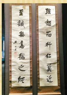
◆「抬棺」收復新疆的清代名臣左宗棠的手書