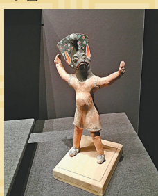
◆唐代彩繪泥塑戴面具舞蹈俑