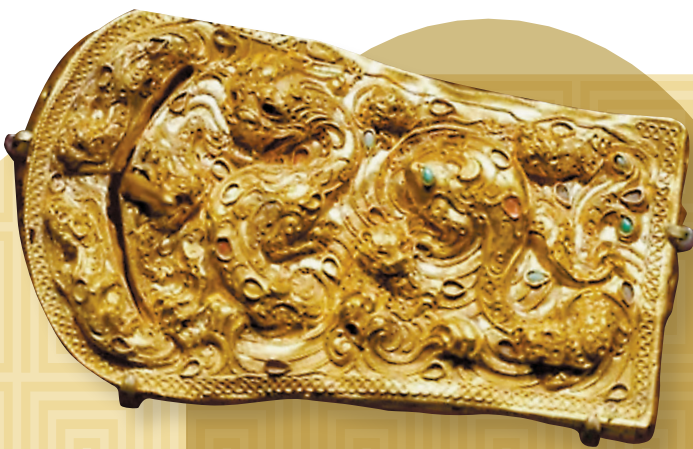
◆漢代八龍紋金帶扣

何嘉說，新疆有9,000多處遺存，數字化體驗廳展出的大部分文物都是出自於這些遺存，為了讓觀眾不僅能夠看到文物，還能夠了解文物背後的故事，看到它所出土的遺存，使文物和遺存相互印證，相互補充，數字化沉浸式體驗項目正是滿足了參觀者的此類需求。