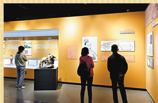
◆遊客在新疆博物館參觀展覽