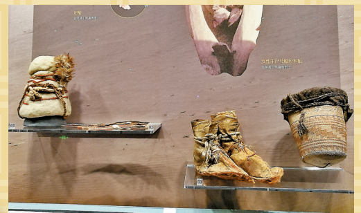
◆新疆若羌縣小河墓地出土的部分文物