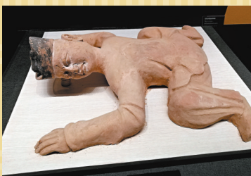
◆新疆吐魯番阿斯塔那墓葬出土的伏聽俑