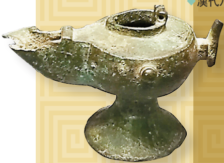
◆烏魯木齊徵集的宋代單柄高足青銅燈