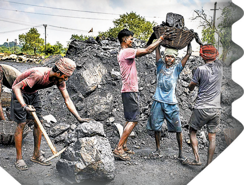
◆歐洲多國尋求從印尼及南非等地進口燃煤。