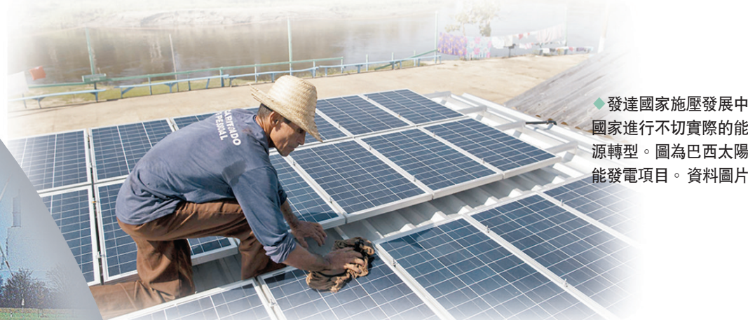
◆發達國家施壓發展中國家進行不切實際的能源轉型。圖為巴西太陽能發電項目。