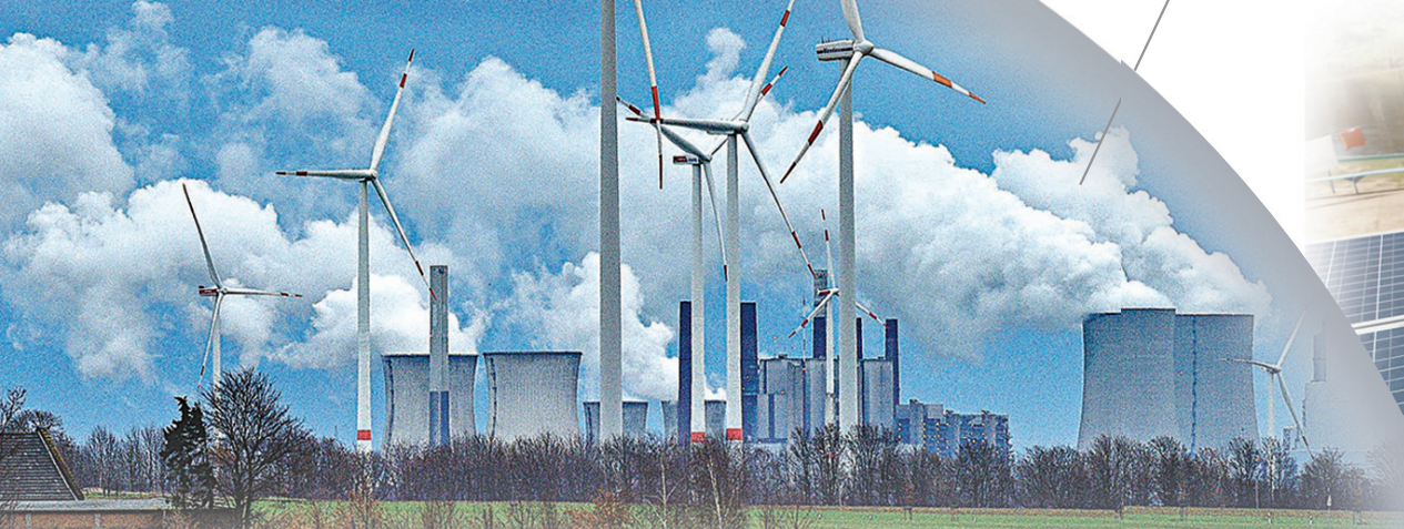
◆德國等歐洲發達國家近日匆忙重投燃煤發電，不願減排承諾走上回頭路。 資料圖片