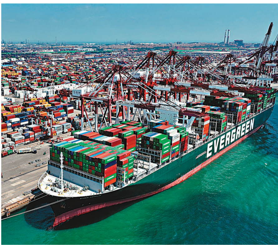
中國與其他金磚國家進出口有望延續去年以來的增長態勢。圖為山東青島港，幾乎每天都有來往於金磚國家港口的貨輪在此裝卸。

當今世界正進入新的變革期，全球治理的缺位和世界經濟復甦的需求正呼喚金磚國家的崛起。報告指出，如今，金磚國家正成為對沖經濟下行壓力、完善全球治理的金磚力量。金磚國家正以全球發展新理念，構建務實合作新平台，經濟全球化新勢力、經濟增長新引擎。