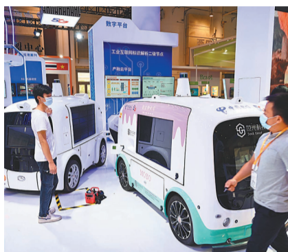
中國製造的智能汽車模型在廈門舉行的2021金磚國家新工業革命展上展出。

具體來看，前5個月，中國對其他金磚國家出口6,560億元，增長18.1%；進口6,517.1億元，增長6.6%。從國別來看，俄羅斯是中國在金磚國家中的第一大夥伴國。前5個月，雙邊貿易總值為4,198億元，增長26.5%。其中，出口1,567億元，增長5.2%；進口2,631億元，增長43.9%。此外，中國對巴西進出口4,150億元，增長7.3%；對印度進出口3,442.5億元，增長10%；對南非進出口1,286.5億元，下降5%。