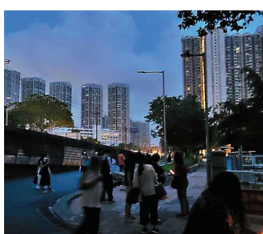
受元朗火燒電橋影響，區內多座大廈停電，有居民下街互通消息。