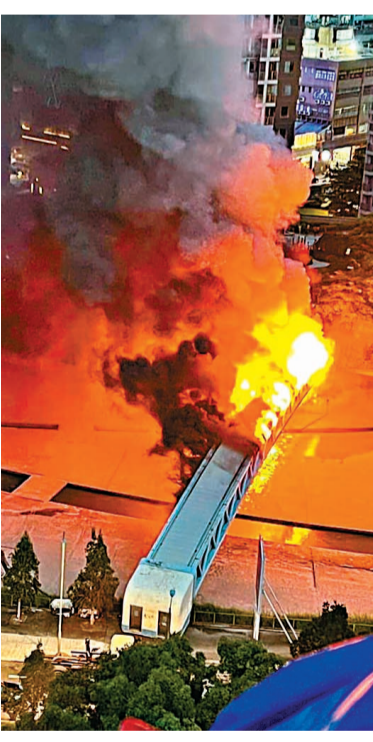
有網民拍攝到輸電橋起火熊熊。