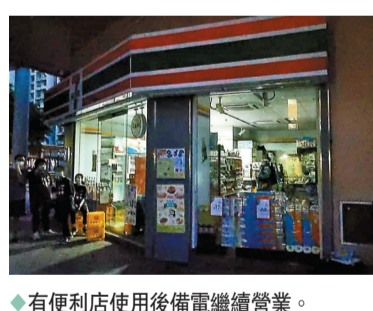
有便利店使用後備電繼續營業。

香港文匯報訊(記者 蕭景源) 香港新界元朗一條輸電橋21日晚起火爆炸，火勢猛烈及濃煙衝天，輸電橋最終斷裂坍塌，事件中無人受傷。受火警影響，新界西北部的元朗、天水圍及屯門當晚出現大面積停電，商場及住宅陷入黑暗，港鐵屯馬線部分車站服務一度暫停，至少16萬戶受影響。中華電力對受影響客戶深表歉意。