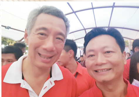
◆與新加坡總理李顯龍合影。

港精神與現今的香港精神，說是移居多年已有「代溝」。但事實上創業成功的人無論過去與現在，勤奮努力都是其中一項重要條件，如今融入大灣區的年輕人也同樣需要。所以，他心中的香港精神其實又豈會「過時」呢？