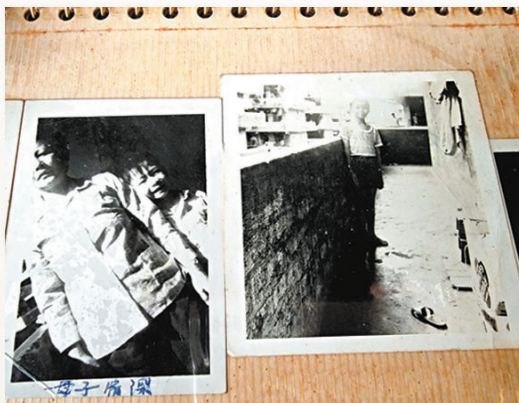
◆童年時在石硤尾與母親合影。