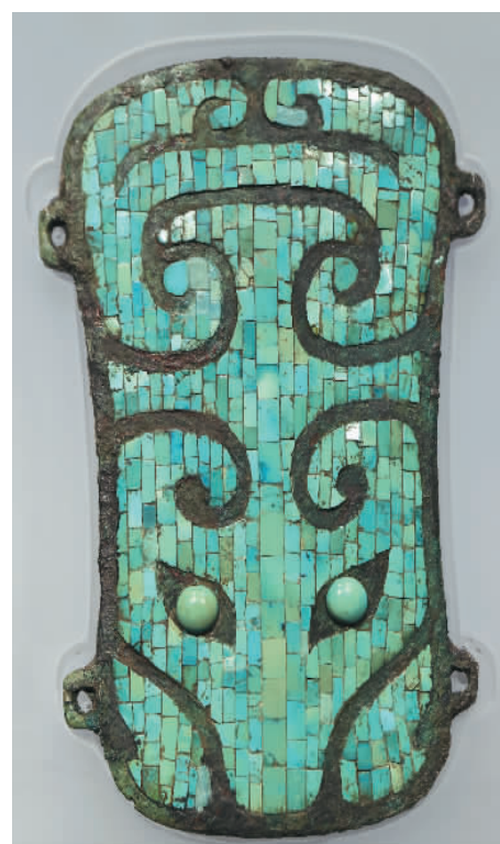
河南偃师二里头遗址出土的嵌绿松石铜牌饰。

中华文明是世界四大文明之一，延绵至今未曾中断，在人类文明史上占有独特而重要的地位。中华文明是中国历史研究、也是世界文明研究的重要课题。中华文明的优秀基因融入了中华民族的血脉，塑造了中华民族的思想品质和价值观。研究中华文明起源、形成和发展的历史脉络，彰显中华文明的成就和对人类文明作出的伟大贡献，对于增强民族历史自信和文化自信具有极为重要的意义。