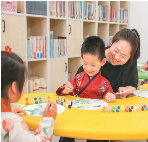
6月14日，浙江省湖州市德清县新市镇镇纪委、妇联共同开展“童心绘团扇，清风润夏至”活动，小朋友们身着汉服学习绘制团扇。

今年6月21日为夏至日，太阳在这天到达黄经90度。至者，极也，夏至意为夏日之极。中国古代先民用土圭测日影，确定一年中正午太阳影子最短的一天为夏至，日影最长的那一天为冬至。对于生活在北半球的我们来说，夏至日是一年中午最长的一天，此后，昼渐短、夜渐长，直到秋分，昼夜等长。