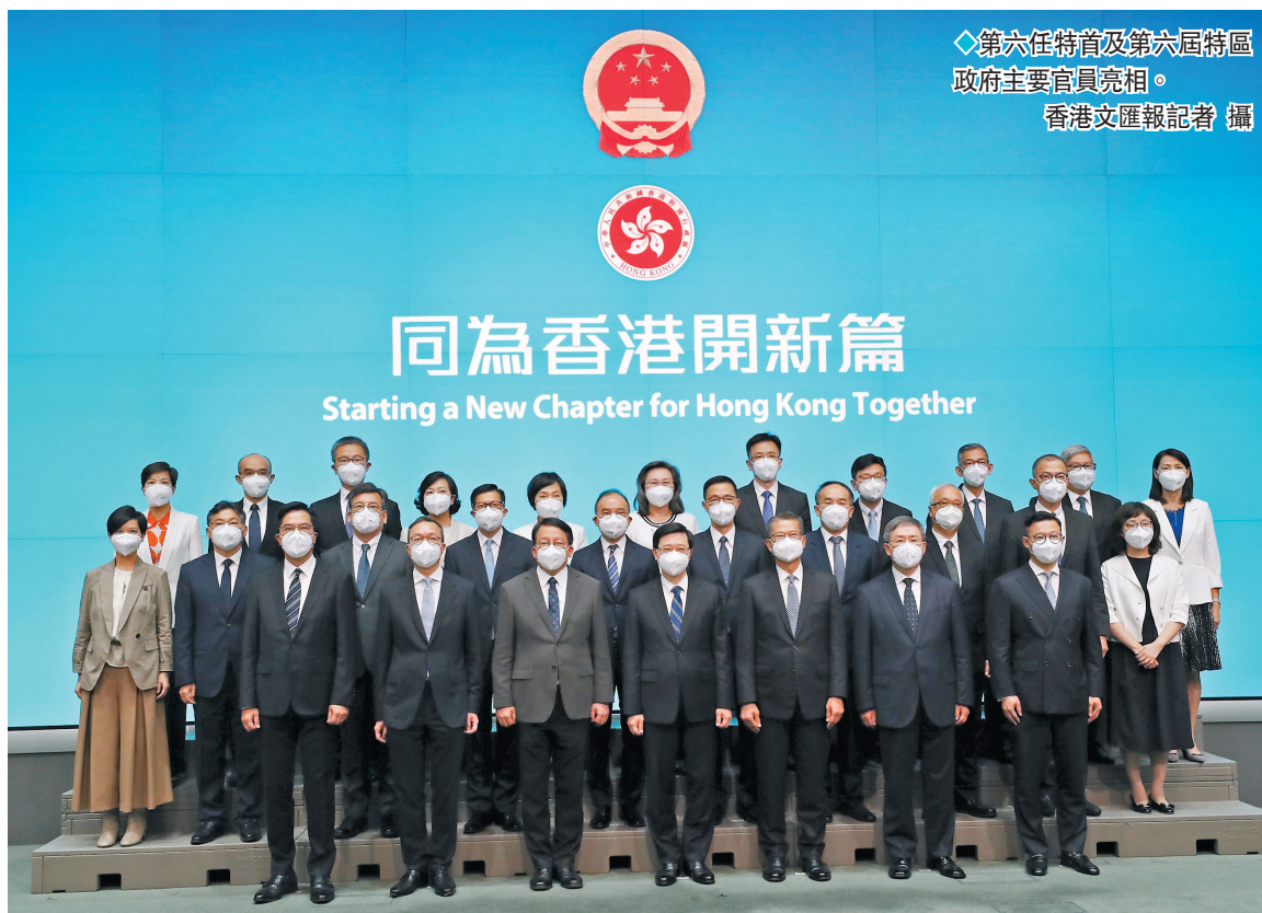
◆第六任特首及第六屆特區政府主要官員亮相。

國務院根據香港特區第六任行政長官李家超的提名，19日任命香港特區第六屆政府主要官員。