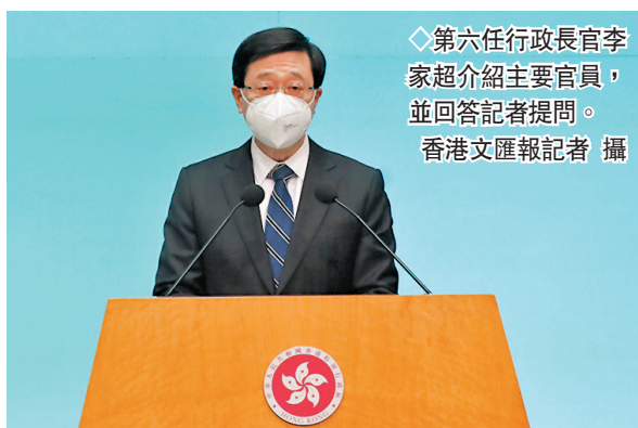
◆第六任行政長官李家超介紹主要官員，並回答記者提問。