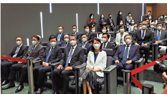
◆獲國務院任命的第六屆香港特區政府主要官員亮相。