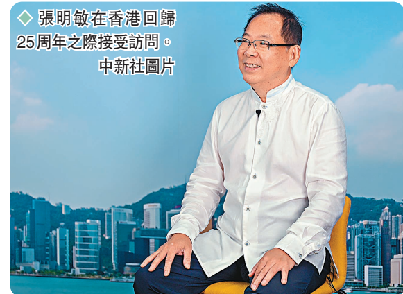
張明敏在香港回歸25周年之際接受訪問。

「《我的中國心》不是屬於我個人的，屬於全世界的華僑華人。『我的中國心』就是如何讓中國更好，讓『一國兩制』在香港行穩致遠，給世界上的人都看到我們中國的面貌。」張明敏說着，稍作停頓，又重複說：「這就是『我的中國心』。」