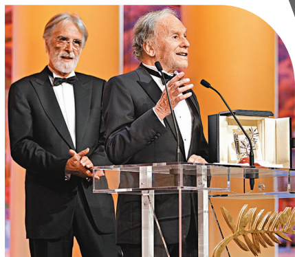
尚路易 (右) 縱橫影壇逾半世紀，曾獲獎無數。

此外，其女兒瑪莉杜寧南 (Marie Trintignant) 亦是演員，但於2003年被搖滾歌手男友 Bertrand Cantat 在酒店房打死，尚路易出席葬禮時被拍到傷心痛哭的畫面。