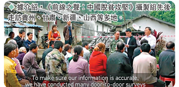
據介紹，《前線之聲：中國脫貧攻堅》攝製組先後走訪貴州、甘肅、新疆、山西等多地。