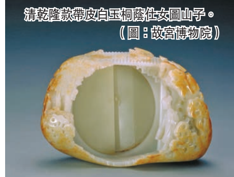
清乾隆款帶皮白玉桐蔭仕女圖山子。

深入解讀歷史人物 展覽「龍顏鳳姿——清代帝后肖像」將展出8件清代帝后朝服像及畫稿，讓觀者深入解讀肖像所繪歷史人物、畫面樣式的時代變遷、服飾元素的象徵意義，亦有白描畫稿展示畫像的製作及文物修復過程。展覽「器惟求新——古代工藝對當代設計」精選故宮博物院93件工藝瑰寶，以設計、製作及使用三個角度解讀中國傳統工藝的藝術價值，展品包括「乾隆款桐蔭仕女圖山子」，此玉雕底部並有乾隆皇帝御筆題寫；另外還有兼具傳統繪畫與雕塑特點的工藝品，標誌着元代鑄銀工藝技術與藝術水平的「朱碧山款槌」。