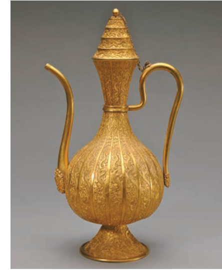
雲龍紋執壺，國家一級文物，金鑿花

香港故宮文化博物館（香港故宮）將於7月2日開放，並以輪換方式展示914件來自北京故宮博物院的珍貴文物，其中不少藏品更是國寶級展品。香港故宮的特別展覽亦會展示由巴黎羅浮宮借出的13件藏品，同場展現古今中外的文化精髓。 北京故宮博物院既是明清故宮（紫禁城）建築群與宮廷史蹟的保護管理機構，也是以明清皇室舊藏文物為基礎的中國古代文化藝術品的收藏、研究和展示機構，藏品總量達180多萬件（套），以明清宮廷文物類藏品、古建類藏品、圖書類藏品為主，藏品總共分為25種類別，其中一級藏品8000餘件（套）。是次到港的故宮博物院文物有逾900件，約七成為首次在港展出，是故宮博物院自1925年創立以來最大規模的藏品出境外借，其中屬國寶級的一級文物多達166件。 香港故宮共有9個展廳，展廳1至7會呈現專題展，介紹明清紫禁城的展覽「紫禁萬象——建築、典藏與文化傳承」和「紫禁一日——清代宮廷生活」，前者展示179件故宮典藏，包括康熙皇帝夏季所穿的國家二級文物「彩雲金龍紋男單朝袍」；後者透過319件18世紀文物探索宮廷生活，包括壺口沿處鑲花下部飾獸面紋的國家一級文物「金鑿花雲龍紋執壺」。香港首次大規模展示故宮陶瓷品的「凝土為器——故宮珍藏陶瓷」，呈現169件各時代的精品陶瓷，如通體施淡天青色釉，釉質瑩潤的國家一級文物「河南汝窯淡天青釉洗」。