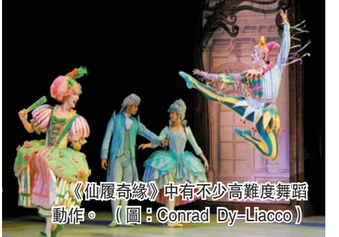
《仙履奇緣》中有不少高難度舞蹈動作。

藝術科技碰撞芭蕾舞 舞團並策劃「下一站，仙履奇緣」互動展覽，於港鐵香港站與香港文化中心展出。展覽裝置融合動作捕捉技術、擴增實境（AR）及傳統芭蕾舞，當參與者靠近裝置，並模仿畫中灰