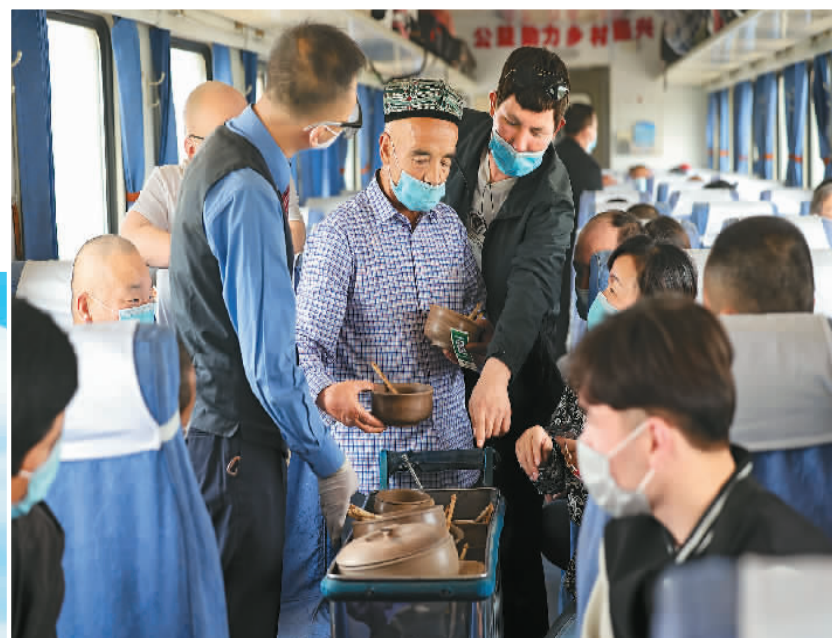
▲ 高速快进的同时,也保留着温情的慢行。穿越天山山脉,行驶在塔克拉玛干沙漠边缘,“和田玉龙号”公益性慢火车像绿色“长龙”穿行戈壁大漠,全程1960公里,历时32小时40分,将乌鲁木齐与和田玉的故乡紧密相连。这趟公益性“慢火车”不仅是连接南北疆的“便民车”,也是周围沿线百姓的“致富车”。因为手工艺人在“和田玉龙号”列车的“流动巴扎”推销手工作品。