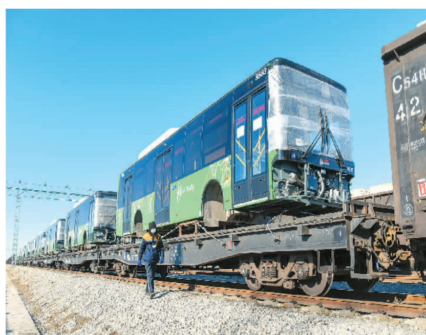
▲ 图为在新疆霍尔果斯铁路口岸,调车人员在检查中欧班列,列车上装载着出口国外的公交车。