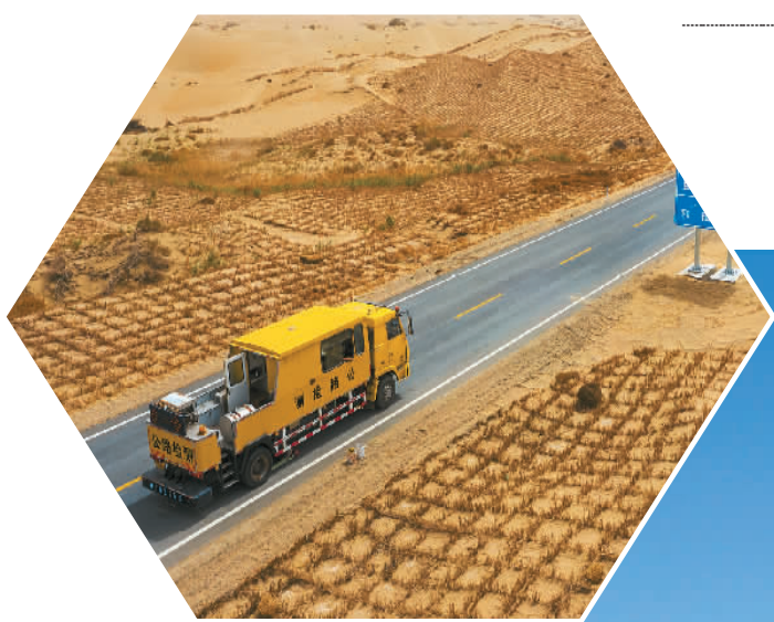
◀ 新疆尉犁至且末沙漠公路是新疆第三条穿越“死亡之海”塔克拉玛干沙漠的公路,预计今年6月底实现全线通车。图为5月13日,在尉犁至且末沙漠公路K039段,搭载路面激光自动弯沉仪的车辆正在作业。