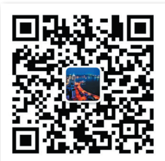
青島發佈 官方微信二維碼