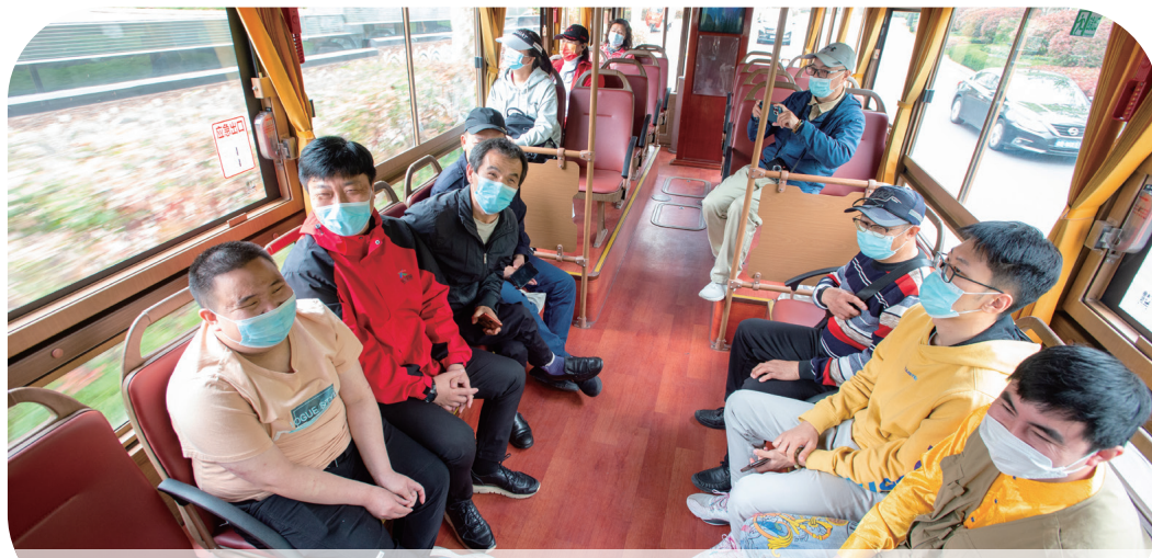
【青島志願者陪伴視障人士乘坐觀光車。】

最近，幾段發生在青島街頭的暖心故事感動了無數網友。患有阿爾茲海默癥的老人為給孫子