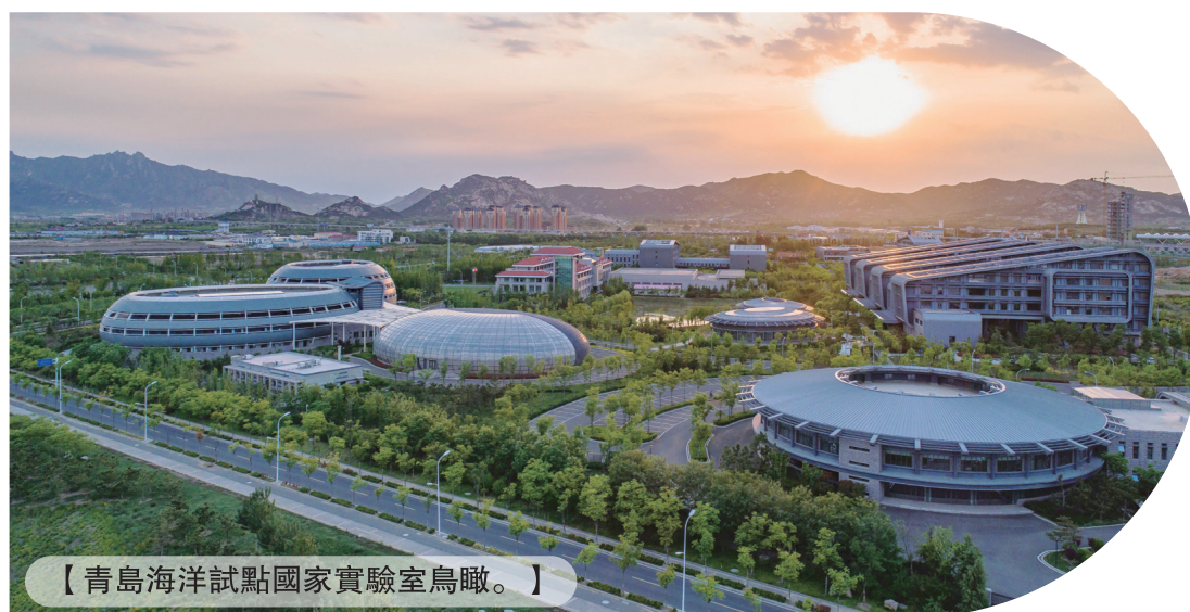
【青島海洋試點國家實驗室鳥瞰。】

海洋試點國家實驗室除還完成了全球首艘10萬噸級養殖工船的養殖工藝及其裝備研發，自主研發的“海燕-X”水下滑翔機在全球首次突破水下萬米的持續觀測，不斷刷新世界紀錄。改性黏土治理赤潮方法與應用技術走出國門，出口美國、智利、秘魯等國家。海洋腐蝕防護與修復技術近四年應用于文昌衛星發射中心等65項工程，估算節約腐蝕成本約31億元人民幣；擁有自主知識產權的4000米級Argo、