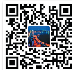
青島發佈 官方微博二維碼