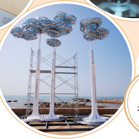
【參展作品《行雲流水》】