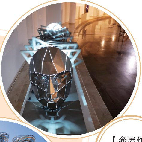
【參展作品《遞》】 攝影 王雷