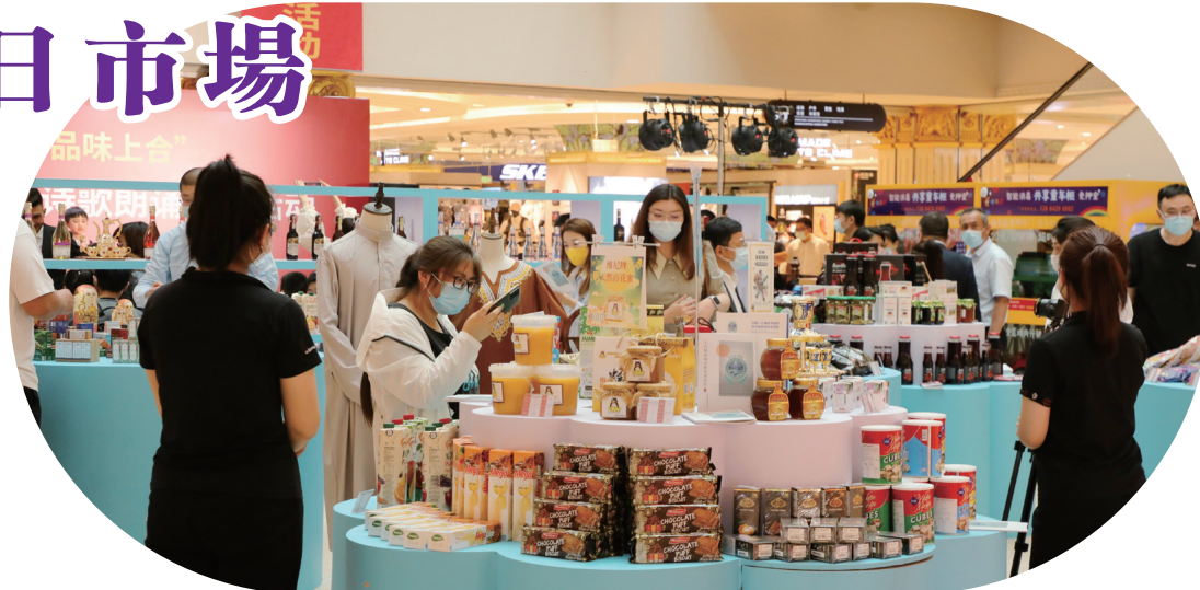
【端午節期間，上合組織國家特色商品展銷系列活動吸引眾多市民游客參與。】

在汽車消費券的有力推動下，疊加車輛購置稅減免政策，截至6月5日12時，青島300餘家參與活動的汽車銷售企業共銷售汽車3573輛，日銷量同比增長42%，呈爆發性增長。（王偉）