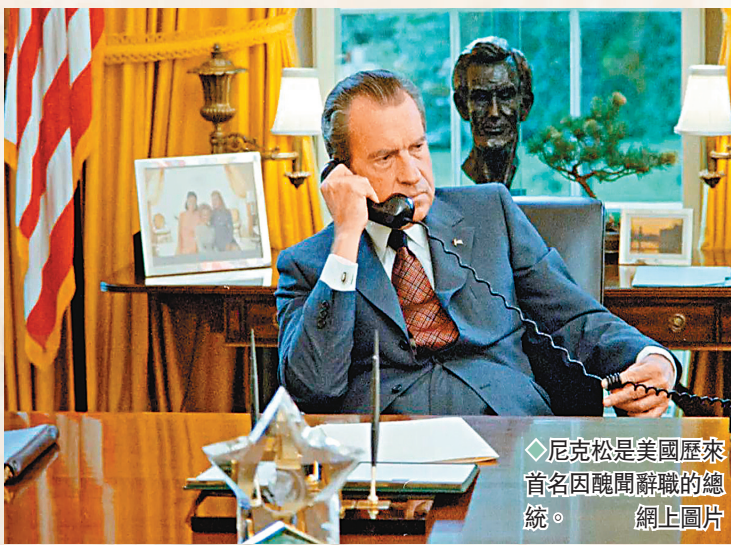
◆尼克松是美國歷來首名因醜聞辭職的總統。網上圖片