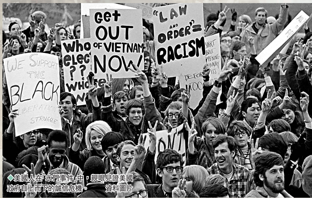
美國人在「水門事件」中，親眼見證美國政府自上而下的誠信危機。資料圖片