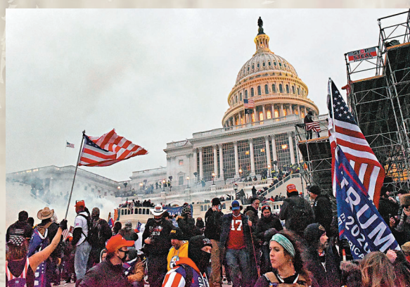
「水門事件」在美國帶來的連鎖反應，最終呈現出一個嚴重分歧和撕裂的社會環境，引發去年國會騷亂事件。資料圖片

民調機構皮尤研究中心從1958年起調查美國民眾對政府的信任度，在最初的調查，多數民眾不分黨派，都普遍相信政府會作出正確決定。該比例在1964年達到77%，即使隨後數年接連發生越南戰爭、前總統肯尼迪及民權領袖馬丁路德金先後遇刺，都未有明顯改變民眾態度。然而經歷「水門事件」，到1974年尼克松辭職後，依然信任政府的民眾的比例已急跌至36%。