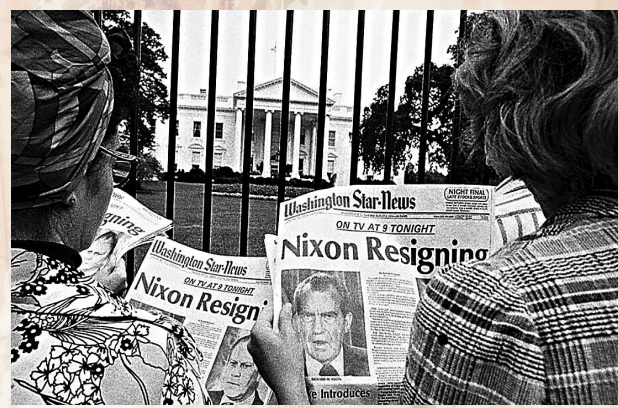
1970年代的傳媒能夠跨越政治分歧，贏得公眾普遍信任。網上圖片