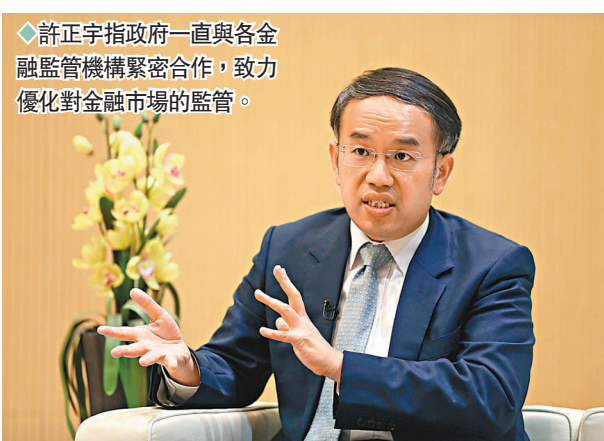
◆許正宇指政府一直與各金融監管機構緊密合作，致力優化對金融市場的監管。

化肥、煤炭、石油、採掘、風電設備、光伏設備等板塊逆市收綠。汽車整車、汽車零部件板塊也跌超過1%。事實上，汽車整車板塊自4月27日觸及階段低點以來，整體股價已反彈逾60%。