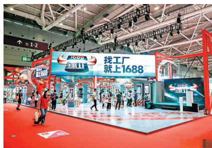
◆阿里巴巴1688展館10多個行業的400多款新品集中展示，包括宅經濟、露營、減壓和健康等領域的爆款產品。

中有進、穩中有增長，1688正在重點開展兩項工作，一是升級買家採購體驗，圍繞「找、挑、詢、付、履」的採購鏈路增強服務確定性和履約保障；二是推動平台供給從多到好轉變，大力挖掘有產品力和服務力的優質供給。