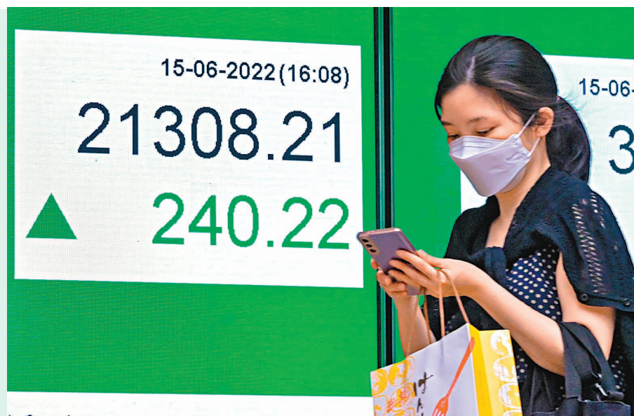
◆受內地零售、工業及固定投資數據表現均勝預期消息刺激，港股A股15日均造好。

新能源車股也有炒作，其中蔚來新產品發布會前，股價抽升12.4%。教育股炒作不斷，新東方在線高54%，收報16.56元，成交額高達38.6億元。新東方也升22.4%，且一度升穿摩通的目標價19元。