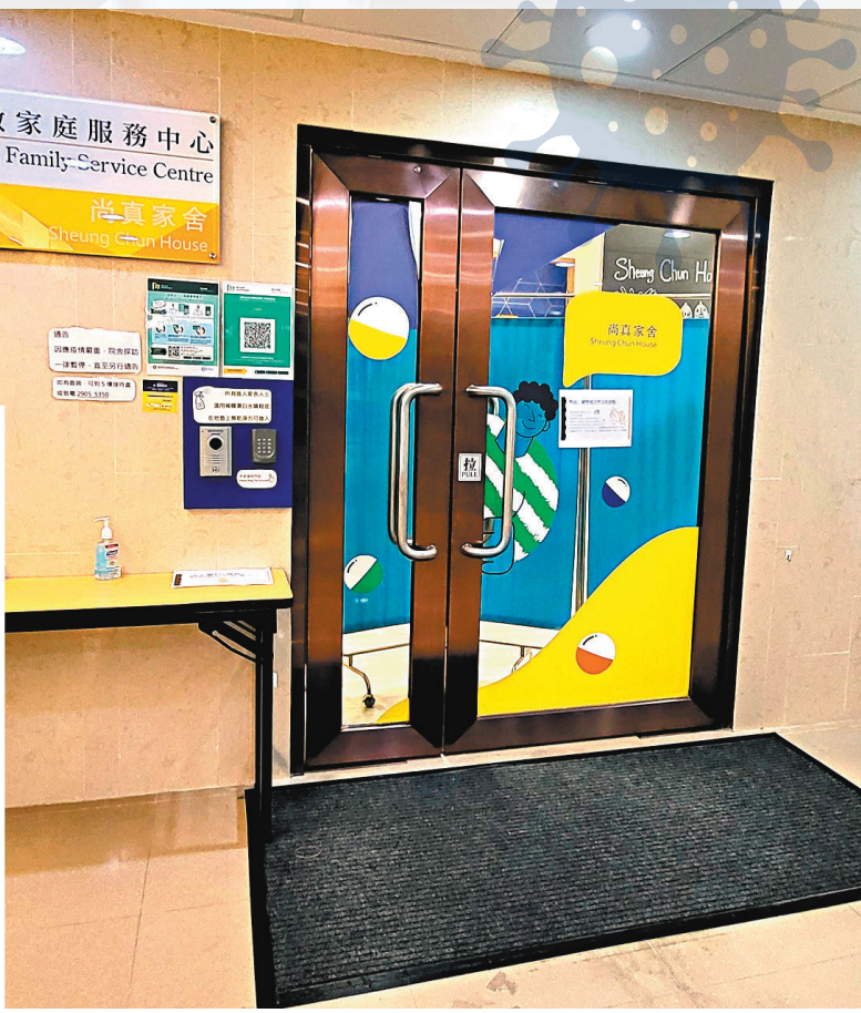
15 日通報有 4 間院舍爆發疫情，其中這間位於觀塘的殘疾人士院舍有 10 名院友確診。