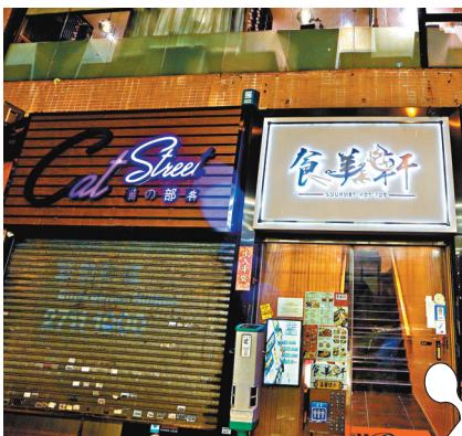
培正中學田徑隊近 70 名師生在何文田太平道美食軒聚餐。

她表示，疫情至今已持續兩年多，特區政府在社會復常、市民承受能力和公共衛生三方面作平衡，最重要在復常的路上有足夠措施，以及安全有序放寬，期望市民和處所管理人守規矩和負責任。政府和醫管局亦已總結應對第五波疫情的經驗，未來若再出現大型爆發，將有不同預案，包括設施、人手和應變方面。