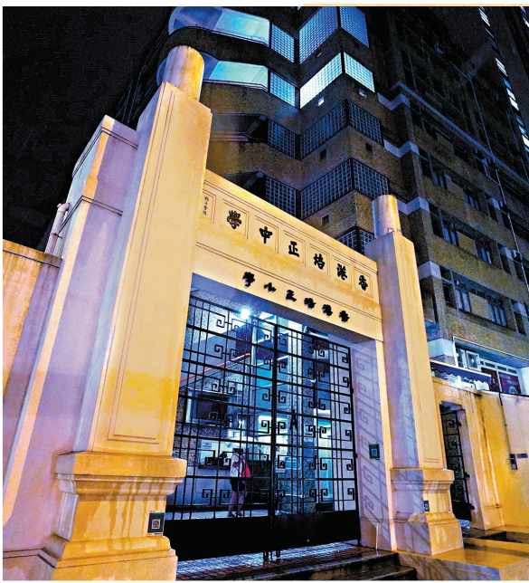
培正中學田徑隊日前有近 70 名師生聚餐，其中 6 名學生確診，包括一名帶有變異病毒株女生。

對於入境檢疫限制放寬令入境人數大增，輸入個案亦按比例上升，梁子超表示，政府必須嚴防輸入個案，以免病毒擴散至社區，包括檢疫旅客接受更頻密的核酸檢測，減少病毒在潛伏期內流入社區的風險，而檢疫酒店員工的檢測次數亦應加密。