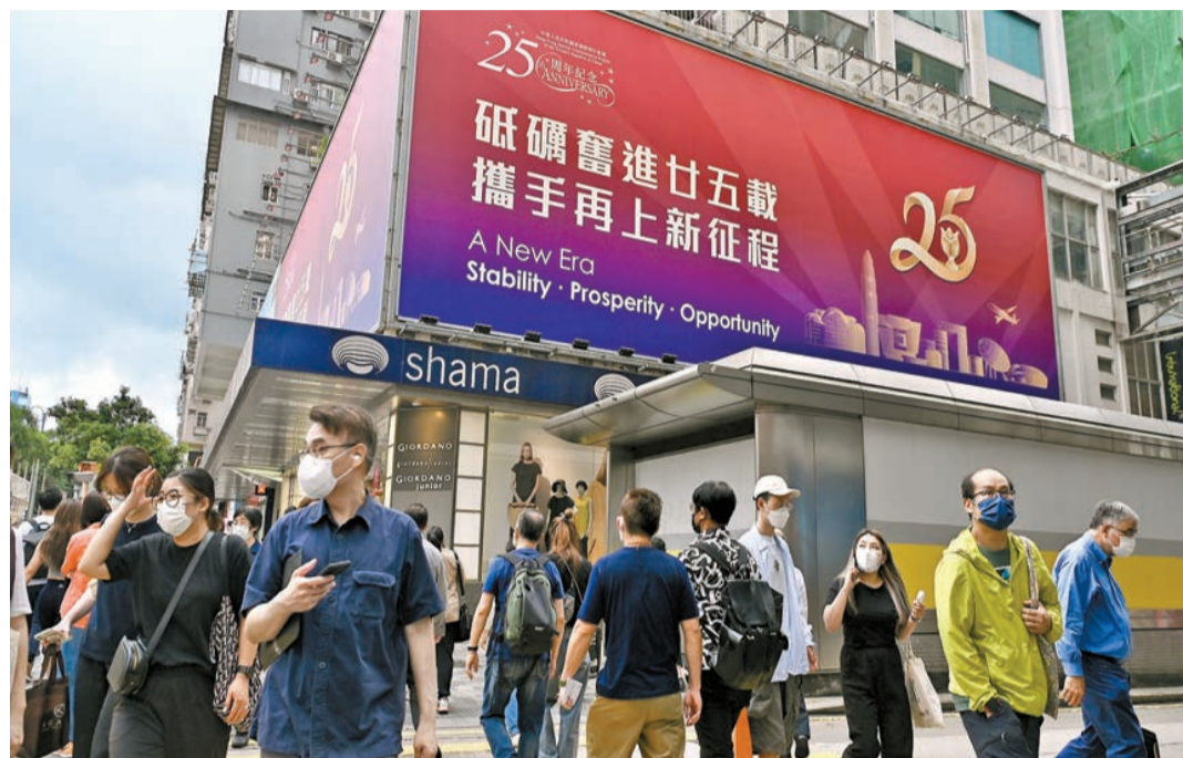
本港多地均有慶祝回歸祖國25周年的廣告，其中就包括尖沙咀街頭當眼處。 中新社