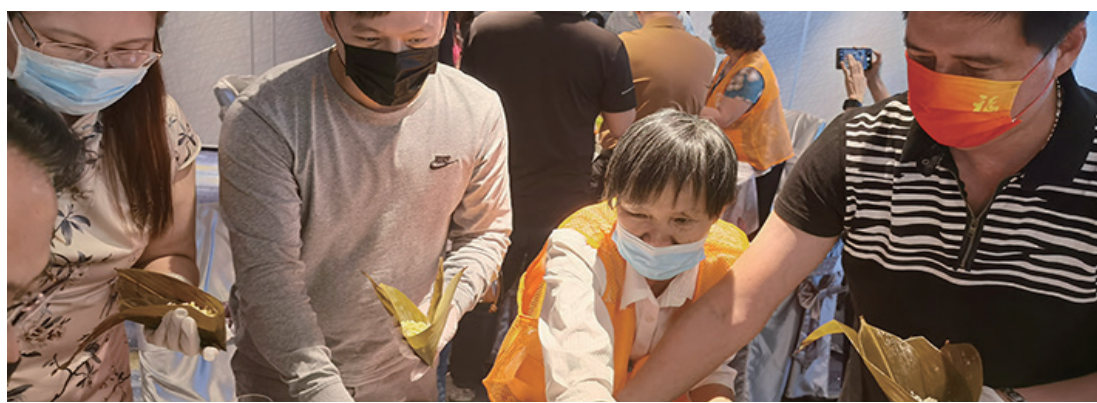
僑胞、港澳同胞在點心師傅的指導下，利用粽葉和糯米等原材料，制作出一條條菱角分明、包紮緊實的粽子。

龍舟起，糯米香。5月20日，我市舉辦“弘揚端午文化 踐行僑都賦能”——江門僑界“品味僑都”交流體驗活動。來自美國、加拿大、巴西、委內瑞拉、伯利茲、庫拉索等10多個國家和地區的僑胞代表、港澳青年代表、江門僑青會會員等，聚在一起暢談江門五邑端午文化，通過雲端與在海外鄉親分享端午節習俗，體驗包粽子，共同感受家鄉味道。