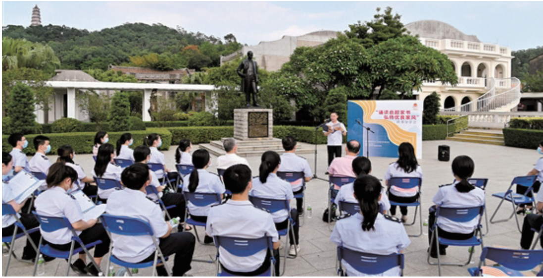
新會區稅務局青年幹部在梁啟超故居紀念館開展“誦讀啟超家書”主題讀書分享會。

從《新民說》到《少年中國說》，一百多年前，在那風雨飄搖的年代，梁啟超積極發聲，用汪洋恣肆的文字，激勵着國人去建設“少年中國”。