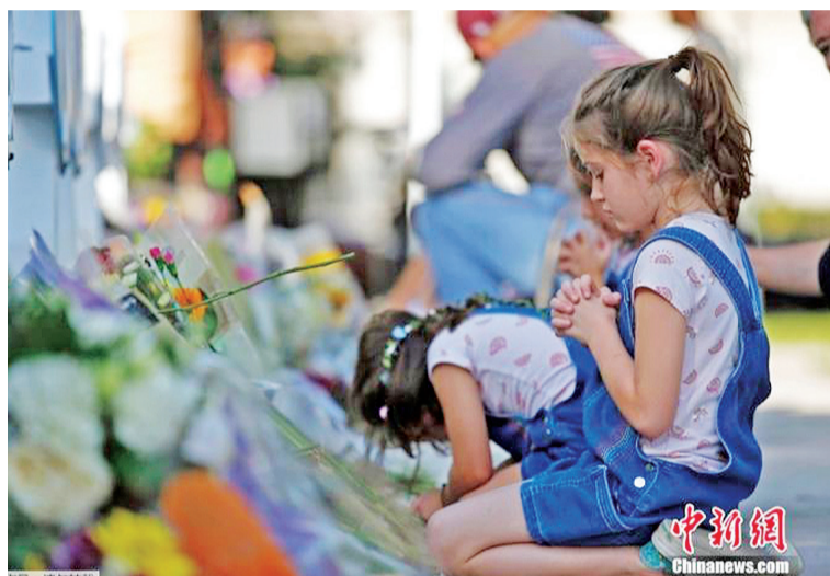
当地时间5月26日,美国得克萨斯州尤瓦尔迪市,民众悼念小学枪击案受害者。

中新网6月16日电 据美国“枪支暴力档案”网站发布的最新数据,截至当地时间15日,美国2022年已有19841人死于枪击,其中包括752名未成年人,另有16799人受伤。