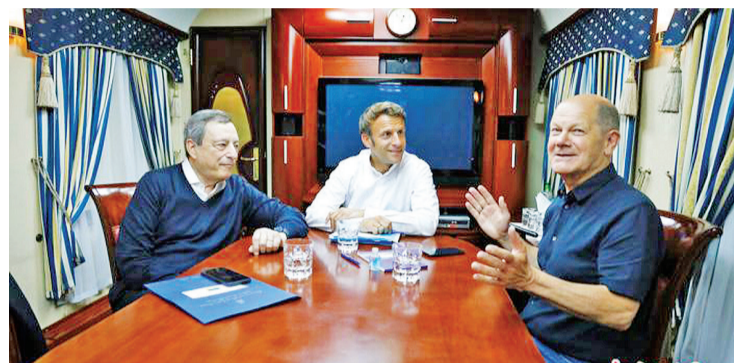
当地时间6月16日,法国总统马克龙(中)、德国总理朔尔茨(右)和意大利总理德拉吉乘坐开往基辅的火车。

中新网6月16日电 据法新社报道,当地时间16日,法国总统马克龙、德国总理朔尔茨和意大利总理德拉吉抵达乌克兰首都基辅,他们将与乌克兰总统泽连斯基会面。