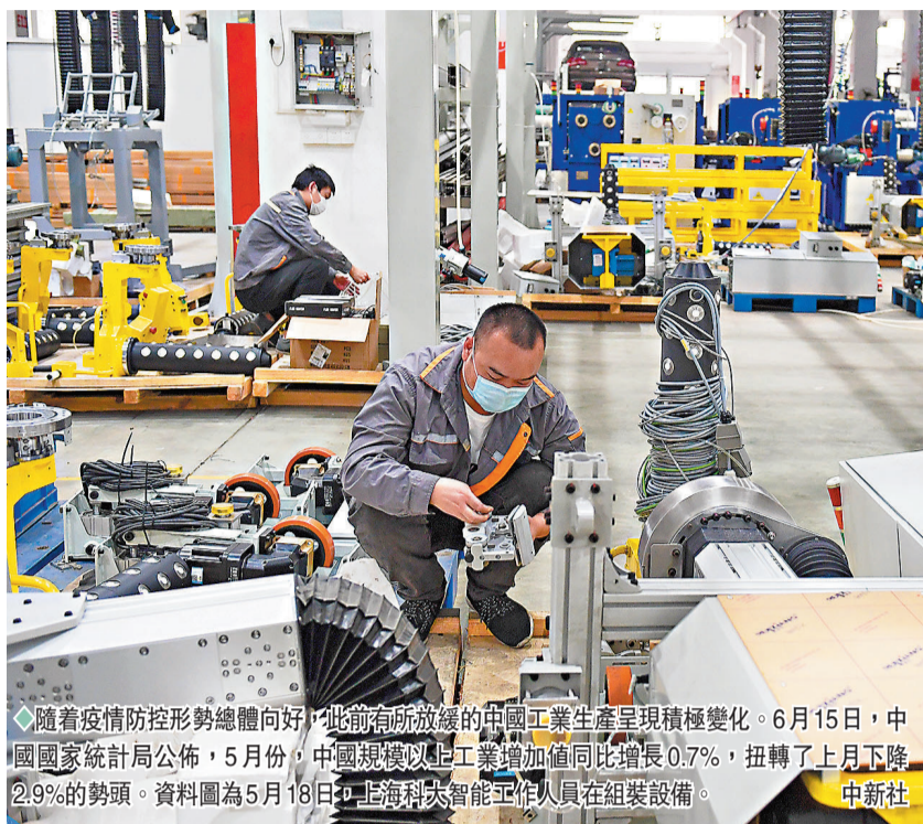
◆隨著疫情防控形勢總體向好，此前有所放緩的中國工業生產呈現積極變化。6月15日，中國國家統計局公布，5月份，中國規模以上工業增加值同比增長0.7%，扭轉了上月下降2.9%的勢頭。資料圖為5月18日，上海科太智能工作人員在組裝設備。