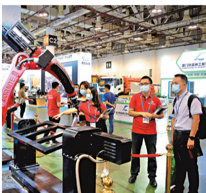
◆圖為客商在廈門一機械工業展會上了解設備。 資料圖片

打破「境外投資主體資格在線認證」這一關鍵堵點，通過遠程在線直接獲取文書等方式，讓境外投資者也能切實享受上海政府服務數字化轉型的政策紅利。