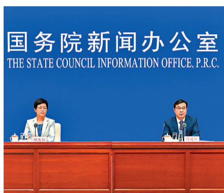
◆國家統計局新聞發言人付凌暉（右）介紹2022年5月份國民經濟運行情況。

在主要經濟指標中，服務業生產指數降幅收窄，市場銷售有所恢復。5月份，全國服務業生產指數同比下降5.1%，降幅比上月收窄1.0個百分點，其中，信息傳輸、軟件和信息技術服務業，金融業生產指數分別增長8.0%、5.5%。當月，社會消費品零售總額33,347億元（人民幣），同比下降6.7%，降幅比上月收窄4.4個百分點，環比增長0.05%。受到社會關注的城鎮調查失業率有所下降。今年1至5月份，全國城鎮新增就業529萬人。5月份，全國城鎮調查失業率為5.9%，比上月下降0.2個百分點。