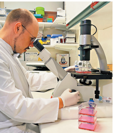
◆圖為專家對病毒進行研究。 資料圖片

香港文匯報訊 據中新社報道，中國國家衛生健康委員會、國家中醫藥管理局日前印發了《猴痘診療指南（2022年版）》，要求一旦發現猴痘疑似病例或確診病例，應及時按照有關要求報告，並全力組織做好醫療救治工作，切實保障民眾生命安全和身體健康。