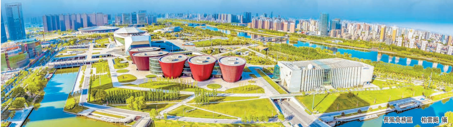
長風商務區

深圳惠科、太重、通澤重工等一批百億級重點項目，目前已安排完成了預選址。招商引資方面，截至目前，在談項目124個，總投資1757.5億元；已簽約蘇州中來20萬噸光伏硅+10萬噸高純多晶硅等項目67個，總投資603億元。