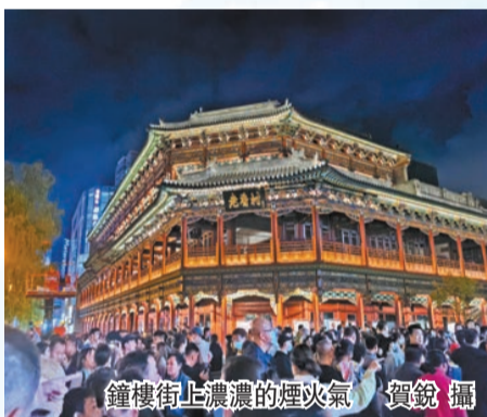
鐘樓街上濃濃的煙火氣