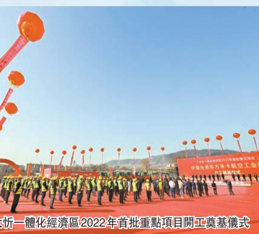
太忻一體化經濟區2022年首批重點項目開工奠基儀式

目前，着眼於「一年見效、三年成形、五年成勢、十年成城」，太忻一體化經濟區已強勢起步。在太原區，大孟產業新城項目有近兩萬名工人、兩千多台各類工程機械在現場施工，所到之處均是一幅幅人員緊張忙碌、塔吊林立、機械轟鳴的火熱場景。而太平洋太原創驅動力中心、太忻雙碳產業園規劃展示中心等項目則進展順利，預計7月中下旬完工。 今年3月28日，太忻經濟區舉行了首批重大項目開工儀式，這其中，太原區開工項目101個，計劃總投資588.94億元，年度計劃投資252.9億元。包含基礎設施項目36個，總投資163.15億元，年度計劃投資149.05億元；產業項目65個，總投資425.79億元，年度計劃投資103.85億元。 同時，太原市還着重招引一批總部企業、鏈主企業向大孟產業新城啟動區集聚，初步謀劃了寧德時代、