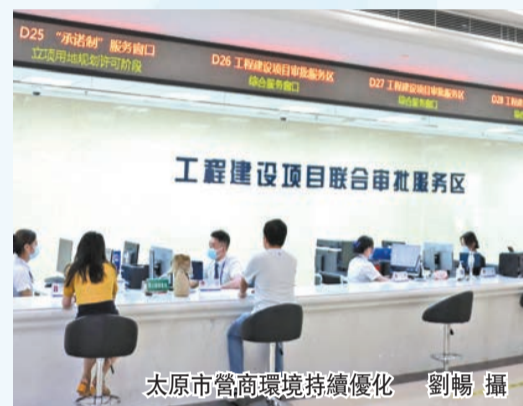
太原市營商環境持續優化

產業、人才、開放「四個高地」，全力實施太忻一體化經濟區與山西轉型綜合改革示範區「一體兩翼、南北呼應、協同聯動」雙引擎戰略，為全方位高質量發展插上了騰飛的翅膀。今天的太原，優勢在集成、資源在集中、動力在集聚，2021年，全市地區生產總值首次突破5000億元（人民幣，下同）大關，躋身全國城市50強。 林宇 楊亮 牛黎