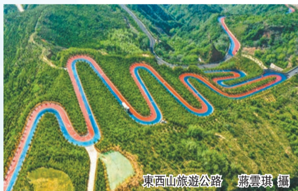
東西山旅遊公路