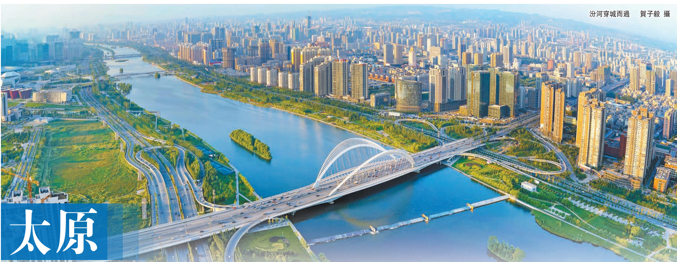
汾河穿城而過