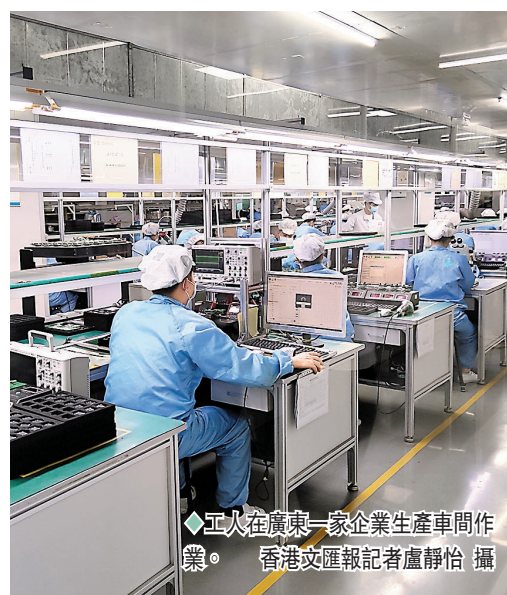
◆ 工人在廣東一家企業生產車間作業。

至於「一帶」沿海經濟帶，則擁有廣州、深圳、珠海、東莞、湛江、江門等6個億噸大港，創造了佔全省八成的經濟總量，產生了佔全省九成的進出口總額。朱偉表示，「十三五」期間660多個投資超10億元產業項目密集落地，巴斯夫、埃克森美孚、中海殼牌等超百億美元重大項目成功落戶這些地方。北部生態發展區方面，其生態產業體系加快構建，現代農業、生態旅遊、文化旅遊等產業蓬勃發展，對接大灣區的「米袋子」「菜籃子」「果盤