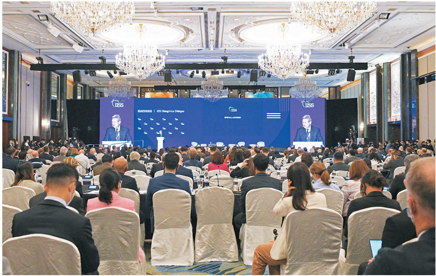
◆ 第19屆香格里拉對話會10日在新加坡開幕，12日閉幕。來自40多個國家和地區的約500名官員、學者等參加，其中包括數十名部長級代表和國防高級代表。 新華社

此外，國際海洋法上根本沒有國際水域一說，有關國家聲稱台灣海峽是國際水域，意在為其操縱涉台問題，威脅中國主權安全製造藉口，中方對此堅決反對。