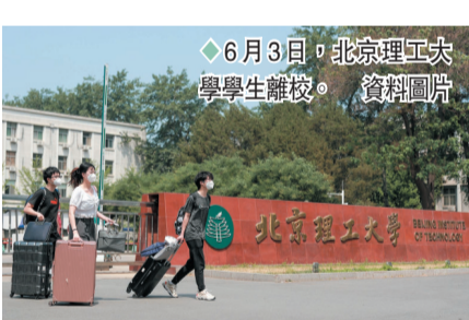
6月3日，北京理工大學學生離校。 資料圖片

離校返鄉政策要求。各地教育行政部門和高校要落實好6月3日國務院應對新型冠狀病毒肺炎疫情聯防聯控機制綜合組印發的《關於做好全國高校學生離校返鄉疫情防控工作的通知》，確保政策執行有力、學生返鄉順利，及時糾正個別地區落實政策時存在的一刀切、層層加碼等現象。二是統籌安排疫情防控和教學工作。各地教育行政部門和高校根據疫情防控形勢、學校封閉管理情況和在校學生數量，按照「省內統籌，一校一策」原則，精準研判、統籌安排學校疫情防控和教學工作。 三是加強對學生關心關愛。要統籌落實疫情防控和校園服務保障，充分了解學生訴求，妥善安排好學生學習、科研、實習、考試等，加強對學生的關心關愛。 四是抓好暑期校園疫情防控。暑期臨近，各地教育行政部門和高校要細化暑期校園疫情防控方案，確保師生健康、校園安全。