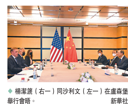
楊潔篪（右一）同沙利文（左一）在盧森堡舉行會晤。

美方必須恪守一個中國原則 楊潔篪強調，在捍衛國家主權和領土完整問題上，中方立場毫不含糊、堅定不移。中國內政不容他國干涉，任何阻撓、破壞中國國家統一行為都必將徹底失敗。台灣問題事關中美關係政治基礎，處理不好將產生顛覆性影響。這個風險不僅存在，還會隨著美大搞「以台制華」、台灣當局大搞「倚美謀獨」而不斷升高。美方不要有任何誤判和幻想，必須恪守一個中國原則和中美三個聯合公報規定，必須慎重妥善處理涉台問題。楊潔篪並就涉疆、涉港、涉藏、南海以及人權、宗教等問題闡明中方嚴正立場。