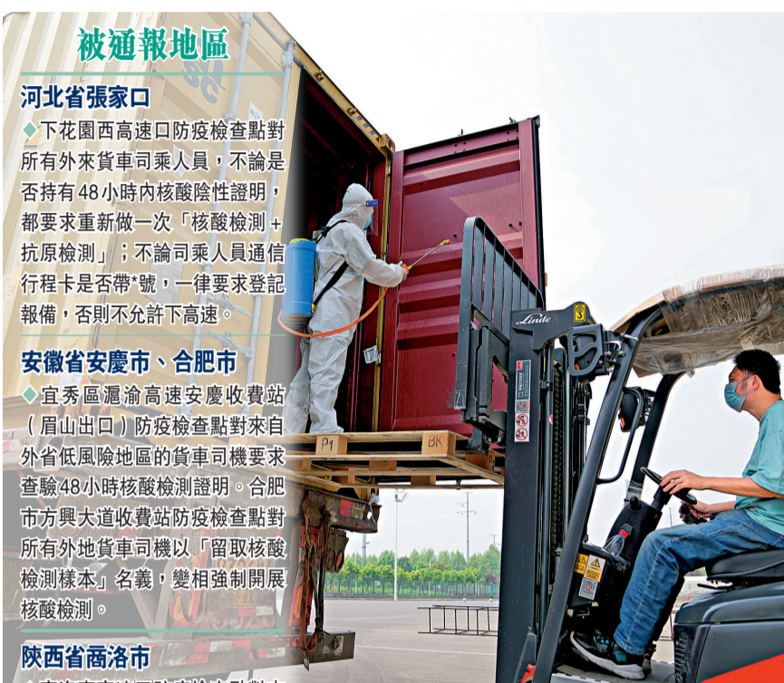
4月12日，在合肥市經濟技術開發區綜合保稅區，工作人員對來自中高风险地區的貨車車廂進行防疫消毒。

「由於疫情已經兩年多，在一些封控城市，很多中小微企業已經到了瀕臨破產的邊緣。」林毅夫強調，在這種狀況下，一定要出台有效的政策來共渡難關，像減稅、免稅、減租金、貸款延期等一系列措施，都是必要的。同時，救助也要關注受疫情衝擊的個人和家庭。在救急措施之外，積極的財政、貨幣政策也要發力，包括支持新基建，為結構轉型升級提供條件。保持一定的增長速度，這是經濟工作應該有的一條底線。