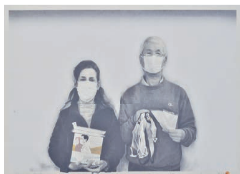
野田哲也作品《日記：2020年3月13日》，2020年。

內容：不少現代人會用手機拍照來記錄生活點滴，而日本藝術家野田哲也則以寫實和藝術方式記述自己的日常生活，繪畫自傳式作品。現正舉辦的展覽「野田哲也的日本當代版畫日記」，展示了野田氏巧妙糅合攝影、傳統日本木刻版畫、油印和絲網印刷技術的作品，展品悉數由收藏家許敏志珍藏，以野田氏於1968年在東京國際版畫雙年展獲傳奇性勝利的事跡為起點，帶出藝術家的創作是如何為版畫藝術賦予新意義。野田氏常以家人、朋友、自畫像、風景、禮物和植物入畫，這些主題貫徹其漫長的藝術生涯，創作一系列有關個人生活而又富有詩意的版畫，相信不少繪畫主題也可引起觀者共鳴。 文：儀