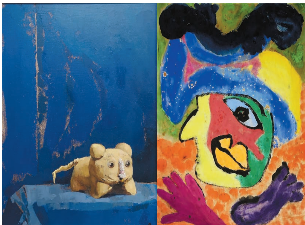
廖東梅作品《面具系列之望月》，2003至2004年。