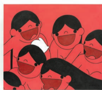
Sko1y 畫作上的色彩被巧妙地分割，且會保留草稿的鉛筆標記和線條，帶有分裂感，同時不失張力。

地點：上環西街38號Nothing At All 內容：紅色時常與憤怒、恐懼和狂暴畫上等號，但在藝術家眼中，紅色卻有「美麗」的意思，充滿了光明。出生在白俄羅斯格羅德諾的藝術家 Skolyshev Vladimir（又稱 Sko1y），在缺乏資源的情況下自學成才，擅長運用大面積的紅色和規整的黑色線條，給觀者帶來強烈的視覺衝擊，其系列作品「紅色女孩」充滿無限幻想。現正舉辦的展覽「Red Girl」展示 Sko1y 筆下的紅色女孩，觀者可欣賞到藝術家筆下清一色披著一頭中間分界黑色長直髮的女孩，帶著白色手套，並擁有「公式化」的開朗笑容，表現出少女的單純美好、大膽赤誠，在現實主義的世界中極具諷刺意味。 文：儀