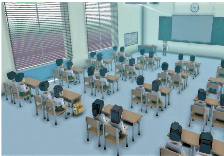
「元·宇宙放榜圍爐」企劃創建的「夠薑蔥5星星學院」特別呈獻「校服祭」，展示30款本地經典校服款式。