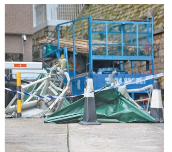
警方用帳篷蓋上遺體，旁為吊船殘骸。

【香港商報訊】記者區天海報道：港島西半山發生吊船從20樓墜下罕見致命工業意外，昨日兩名工人在干德道一屋苑進行檢測吊船時，懷疑鋼纜突然斷裂，兩名工人連人帶吊船飛墜20層樓，當場傷重死亡。勞工處正就意外原因展開調查。