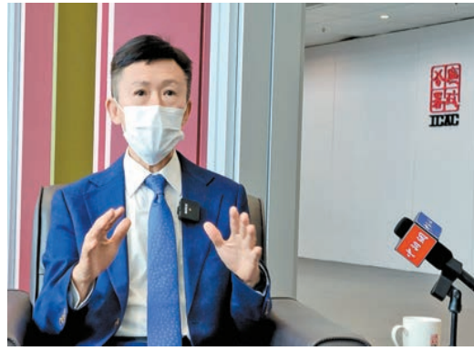
白韞六表示，當選為國際反貪局聯合會主席，令國際對香港廉政等各方面的發展建設更有信心。

【香港商報訊】記者戴合聲報道：香港廉政專員白韞六於2022年初當選為國際反貪局聯合會新一任主席，他近日在香港接受中新社記者專訪時表示，當選一方面展示了國家的軟實力，另一方面也令國際社會對香港在廉政等各方面的發展建設更有信心。