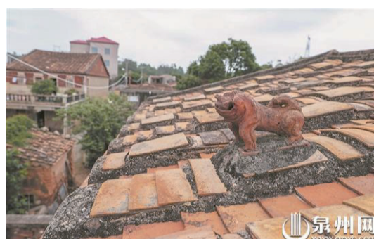
獅形厭勝物放置在屋頂上,被賦予了安居之意。