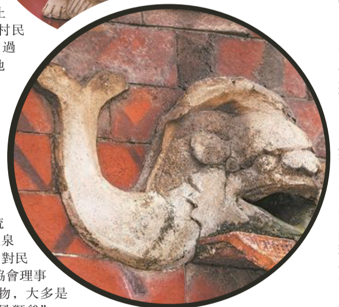
古厝屋檐下的魚尾獅排水口

張,遠觀像是正在對天大吼,甚是威武。為何這一獅形厭勝物的表情如此特別?當地的老人家回憶,這與一段傳說有關,相傳古時候村裏有調皮的孩子,常會爬到風獅爺身上玩耍,有一次甚至尿在了風獅爺的頭上,風獅爺一怒之下,一甩頭這孩子就從獅身上滾落下來,並磕掉兩顆牙。家長得知後,趕緊帶著孩子取了些鹽巴和稻米,來到風獅爺跟前,由孩子本人將舊牙、鹽米一併放在風獅爺的嘴裏,行跪拜大禮祈求原諒,同時口吟俗語:“一粒鹽、一粒米,和您風獅乞牙齒。”風獅爺因被其誠心所感動,便將獅子般堅硬的新牙賜予這孩子。傳說代代相傳至今,人們便將能賜予孩童健康牙齒的風獅爺打造成吼獅的樣子,並安放在屋頂上,並由此衍生出一個獨特的習俗——生活在虎石村的孩童,每當乳牙脫落,便會被家長帶到吼獅前,立正站好後,輕輕將乳牙拋進吼獅的嘴中,祈願能獲得一口健康的牙齒,家長則求吼獅庇佑孩子茁壯成長。