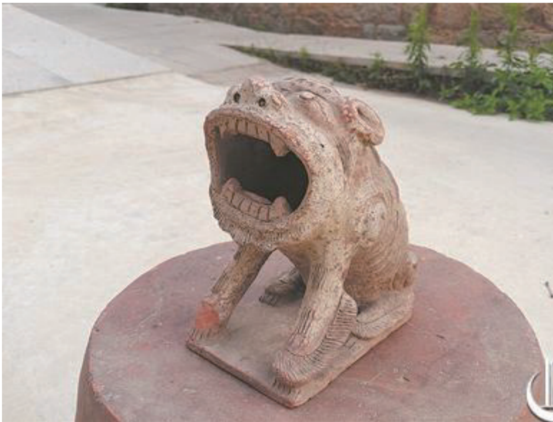
傳說能庇佑孩童成長的吼獅

在泉州民間傳統文化裏面,獅子是吉祥的瑞獸,依托其形態打造而成的厭(念“yā”,通“壓”字)勝物,也常被賦予安居和鎮宅的寓意。在泉港後龍鎮虎石村中,