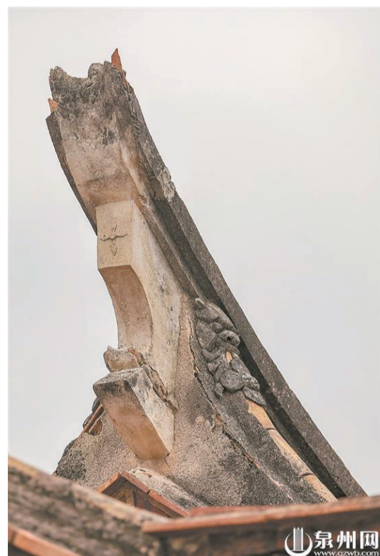
燕尾脊上的灰塑獅頭裝飾物