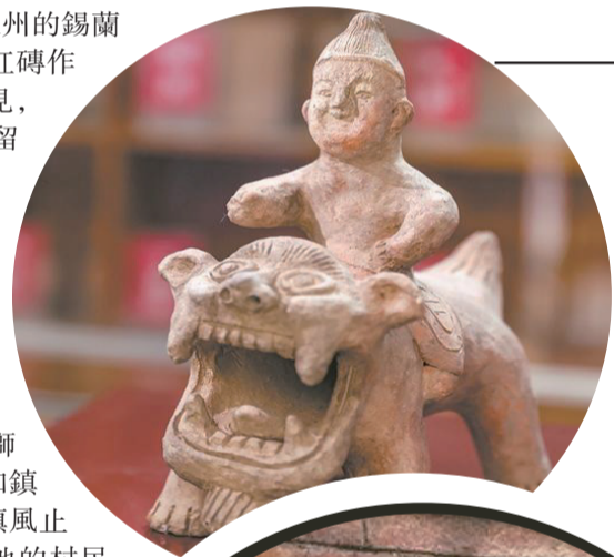
將軍與獅子結合的厭勝物,也被稱為“瓦將軍”。

如今,隱匿在虎石村中舊巷裏的黃氏舊宅,因年久失修,屋頂厝頂已有些破敗,但仍吸引了不少古建築愛好者趕來“打卡”。原來,大家都是為一睹置於厝頂上的一座別致的紅磚獅形厭勝物,其嘴巴張開,但牙齒緊咬,獅鼻揚起,前面的雙腳蹬地,後面的雙腳則微微彎曲,好像為一躍衝天而蓄力。同樣吸引訪客們目光的,還有保存在虎石村閩南紅磚文化展示館展廳中的一款獅形厭勝物——吼獅。不同于常見傳統的風獅爺造型,吼獅的面部表情顯得誇張一些,獅口大