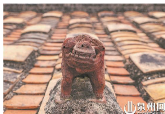
紅磚打造的獅形厭勝物,顏色更為亮眼。