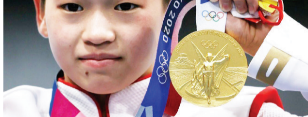
15岁的全红婵对于即将开始的游泳世锦赛为自己设定的目标是两个冠军

上周,中国跳水队公布了参加今年世锦赛的大名单。作为奥运冠军,全红婵即将迎来自己的又一个“大考”。出生于2007年的全红婵赛前给自己定下目标——“两个冠军”!