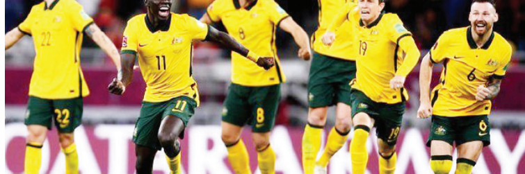
澳大利亚晋级世界杯决赛圈

北京时间6月14日02:00(卡塔尔当地时间13日21:00),2022世界杯附加赛展开争夺,澳大利亚通过点球大战5比4险胜秘鲁。澳大利亚第6次入围世界杯决赛圈。