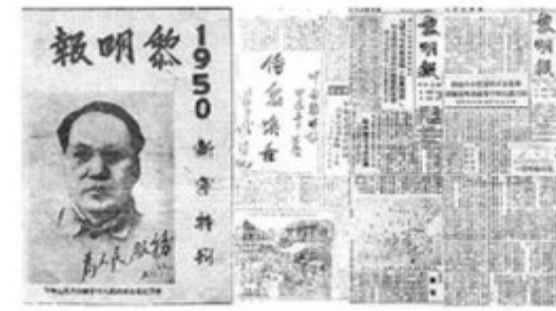
当年创刊不久的黎明报

人社会体验人生,既培养了我的独立生活的能力,又增加了我的社会经验,对我以后走的人生道路起到了很大的影响。可以说:“报童带领我们走进知识宝库的大门;黎明报引导我们步入社会实践的大